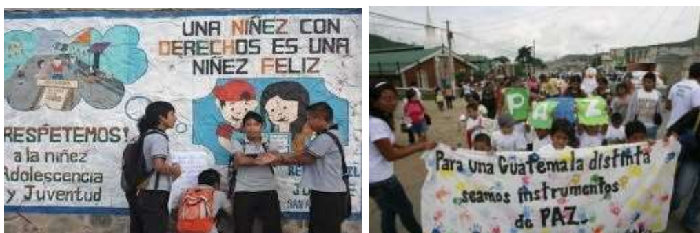
Figuras 17 y 18:

La exigencia de no más trabajo infantil debe de ser una de las luchas de mayor relevancia, el exigir la aplicación de leyes y convenios nacionales e internacionales, para que el Estado de Guatemala, invierta más en salud , educación , recreación, fortalecer los programas y proyectos en pro de la niñez y adolescencia debe de ser una política global, así como generar fuentes de trabajo en busca de mejores condiciones de vida para disminuir los índices de pobreza y pobreza extrema que afecta a nuestros pueblos.