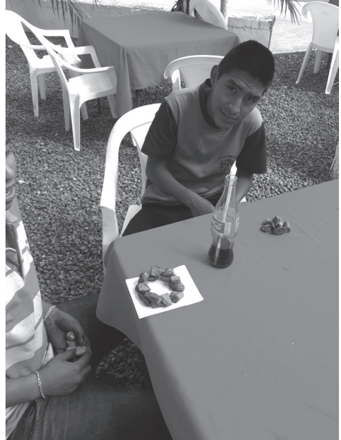
Figura 12 "Túneles de agua" construcción hecha con piedrines por lustrabotas en el campus de la USAC, fotografía arquitecto Walter Aguilar, 2016.

Es el entorno donde el ser humano realiza sus actividades, puede ser interior y/o exterior, es una superficie delimitada, la cual tiene un uso definido, es un objeto de cambio que tiene una vida útil.