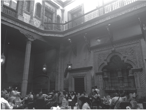
Figura 7 Casa de los azulejos, fotografía de Mario Ramírez, mayo de 2016.

En las siguientes sesiones, se procedió a leer los post it, incluso a complementar o ampliar lo escrito, en total libertad y amplitud de criterio.