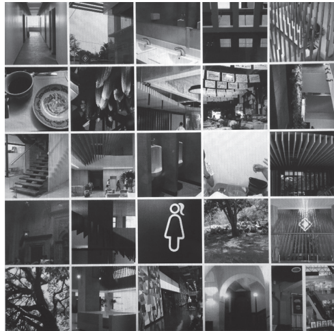
Figura 9 Composición de fotografías, Mario Ramírez, junio de 2016.