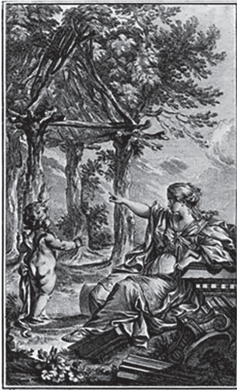
Figura 15 La Cabaña primitiva, grabado de Charles Eisen, en la segunda edición (1755) del Ensayo sobre la arquitectura, de Marc Antoine Laugier.

bien, la metáfora ochocentista de la cabaña del abate Mar Antoine Laugier en su Ensayo sobre arquitectura. 7