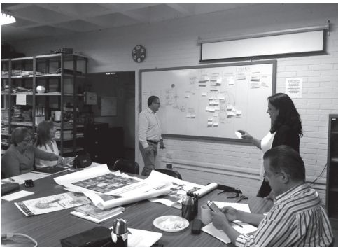
Figura 14 Sesión de trabajo en Nivel de Formación Básica, 2016.

Espacio Arquitectónico, es la intervención que realiza el hombre al espacio natural, para suplir su necesidad de habitar, socializar y llenar su espíritu con el único sentimiento de realizar un sueño, (de perpetuarse).