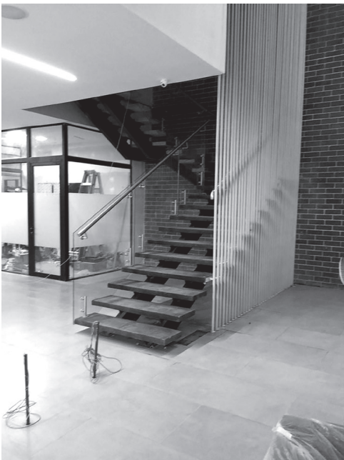
Figura 4 Gradas de acceso, Lobby distrito Miraflores, obra de Axel Paredes, junio de 2016.