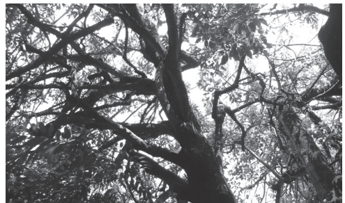
Figura 2 Árbol, fotografía de Brenda Porras, junio de 2016.