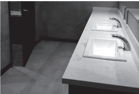
Figura 5 Baños, fotografía de Marco de León, junio de 2016.

La iniciativa tuvo buena participación, mostrándose las fotografías al grupo y reflexionando sobre el significado de las mismas.