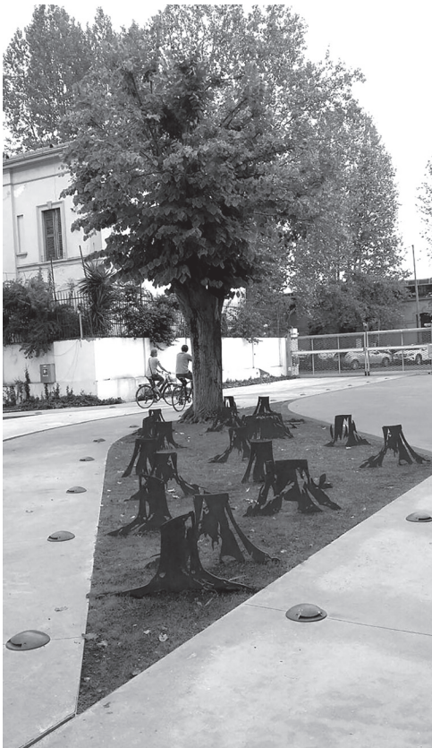
Figura 1 Espacio público en Roma, Italia, fotografía de Francesca Giofré, Università degli studi di Roma, Sapienza, junio de 2016.

En la Figura 1, se observa un espacio público, en Roma, Italia, con una curiosa representación de tocones de árboles talados como parte del arreglo urbano. Curiosamente, en la Figura 2 se observa un árbol vivo, cuya copa propicia la percepción de un espacio interior en la misma. En la Figura 3 el espacio se configura alrededor de un grupo de vacas que descansan plácidamente a la sombra de un árbol.