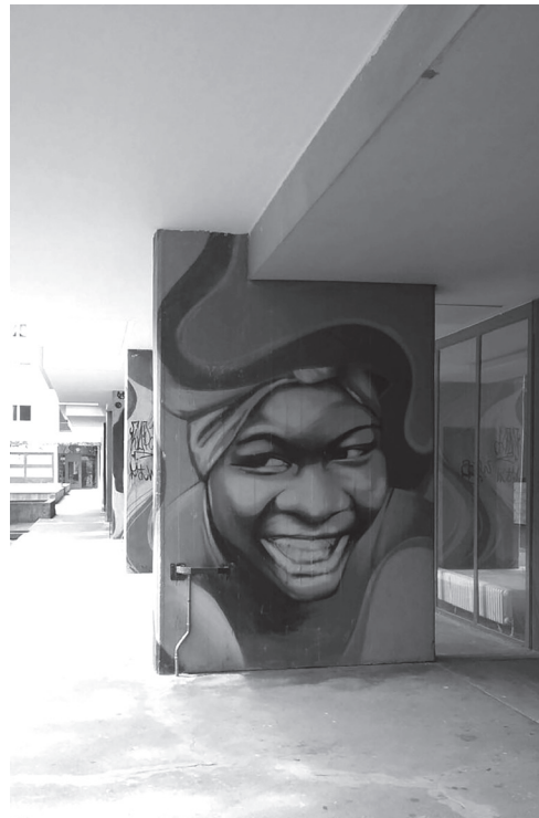
Figura 6 Columnas, fotografía de Francesca Giofré, Università degli studi di Roma, Sapienza, junio de 2016.

Para extraer las principales categorías relativas al espacio en arquitectura, se utilizó la técnica del post it (Figura 10), en la cual, al mostrar las fotografías se anotaban las respuestas en post it de dos colores, uno para anotar las reflexiones relativas a ¿qué es un espacio arquitectónico? Y en otro color para ¿qué no es un espacio arquitectónico? En la técnica empleada se aplican principios de recolección de información de grupos, tales como la tormenta de ideas, la tormenta de escritura, el método Crawford. 4