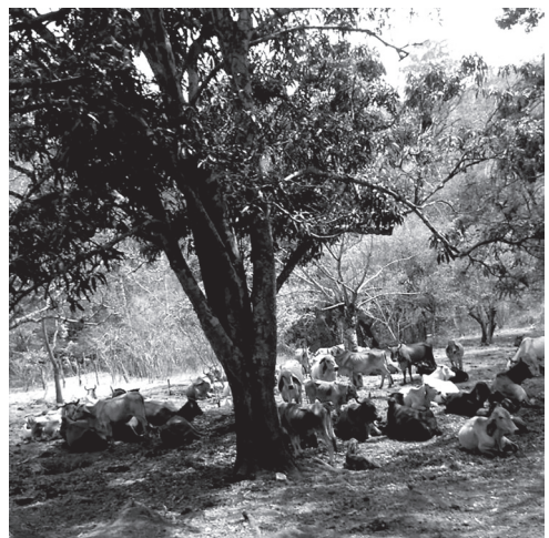
Figura 3 Descansando, fotografía de la agrónoma Ligia Monterroso, junio de 2016.