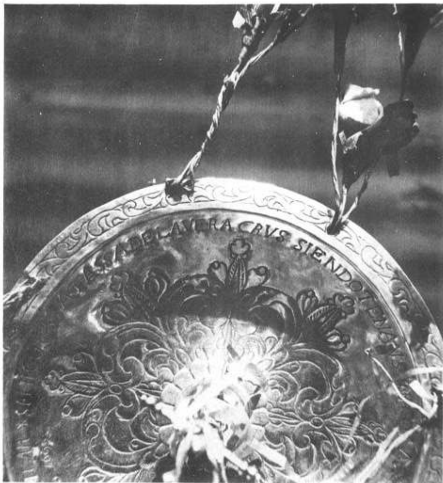
Plato de plata, una de las reliquias de las familias Carmona y Granizo.

La historia sagrada relata asimismo que la madre del Emperador, Elena mujer piadosa, de 80 años de edad, subió al Monte Gólgota con el deseo de descubrir la Cruz de Jesucristo (el Sagrado Madero). Los gentiles habían edificado en el sitio del Santo Sepulcro, un templo dedicado a la Diosa Venus. Lo primero que hizo Elena fue mandarlo a demoler y ordenó cavar hasta que se descubrió el Santo Sepulcro. Junto a él, se encontraron tres cruces iguales, sin que se distinguiera cuál era la de Cristo, pues el rótulo que decía "Jesús Nazareno, Rey de los Judíos", se había caído y estaba en medio de las tres. Para dilucidar cuál era la del Salvador, fue necesario comprobarlo a través de milagros, es decir, aplicando las tres cruces a enfermos y muertos. Una de las cruces operó milagros. La Emperatriz Elena mandó a edificar una gran iglesia en el sitio en donde se había hallado la cruz, y dejó allí un pedazo de la misma; otro se lo mandó a su hijo Constantino y el tercero lo envió a Roma.