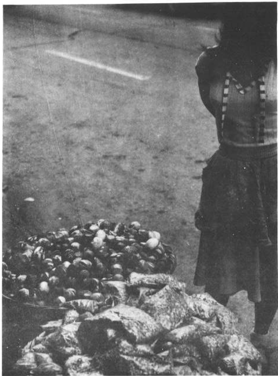
En diversos sitios de la ciudad se encuentran puestos para la venta de "cascarones" y "pica-pica"