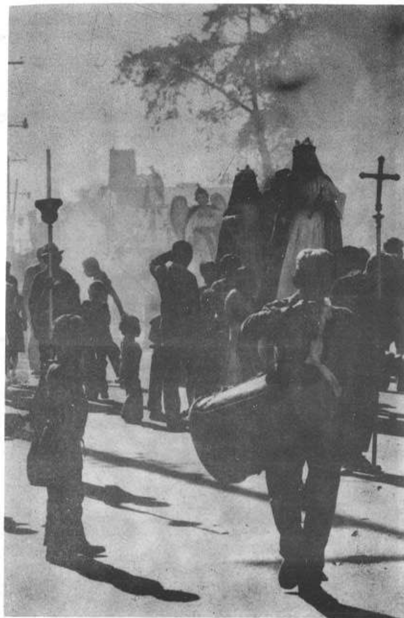
El 'rezado' del Día de Reyes lo encabeza un tambor.

El 1o. de enero se efectuaba el convite. A eso de las nueve de la mañana sonaban las campanas y se quemaban cohetes anunciando el inicio del famoso convite. Cada año distinto, una vez los fieros así le decían a los diablos; otro la Conquista o el Venado, el Torito o Gigantes, saliendo todos los años los viejos y los micos, encargados de