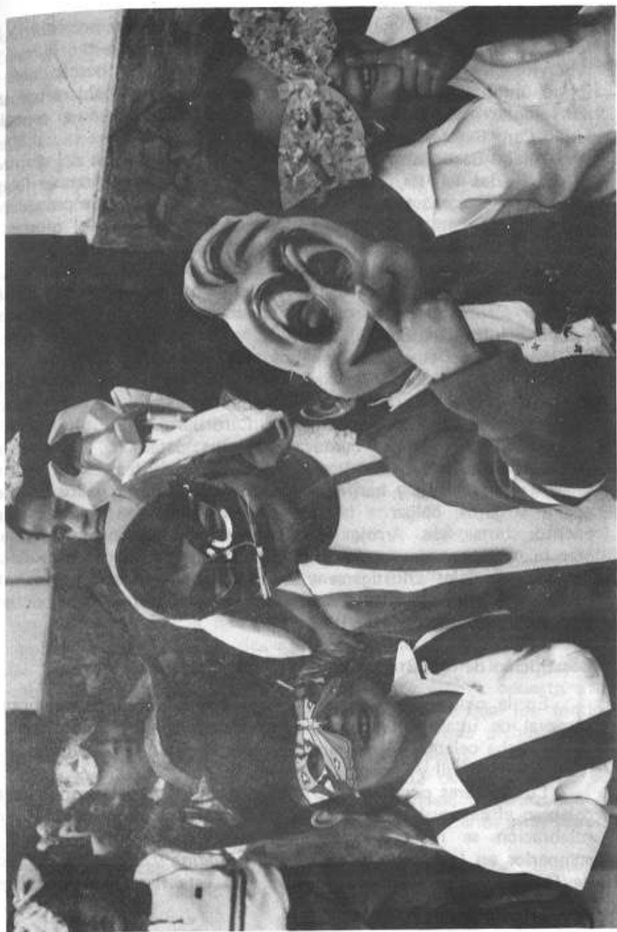
Grupo de escolares con máscaras y antifaces para el "martes de carnaval"