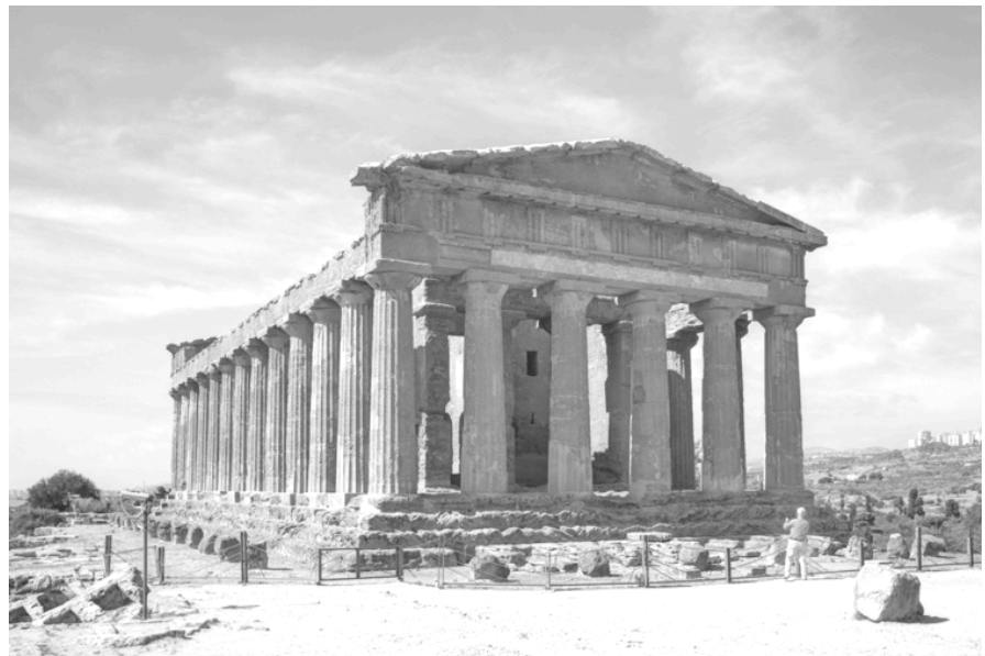
Figura 4. Templo de la Concordia. Este templo griego clásico fue erigido al sur de Italia entre el siglo VI al V antes de C., se encuentra sorprendentemente conservado y fue estudiado por Winckelmann, junto con otros templos, para comprender la belleza lograda por una esmerada composición con elementos, partes y proporciones por los arquitectos griegos antiguos. 2012. El valle de los templos en Agrigento, al sur de Sicilia, Italia.

Winckelmann retoma o subraya del célebre escultor y arquitecto del Renacimiento Miguel Ángel la siguiente consideración "quien constantemente siga las huellas de otro, nunca avanzará, y quien no sabe hacer nada bueno por sí mismo, tampoco sabrá servirse bien de las cosas de otros". Y agrega que a los talentos a los que la naturaleza ha favorecido tienen ahí abierto el camino de la originalidad (Winckelmann, 1755, p. 87). Pero asegura que en la