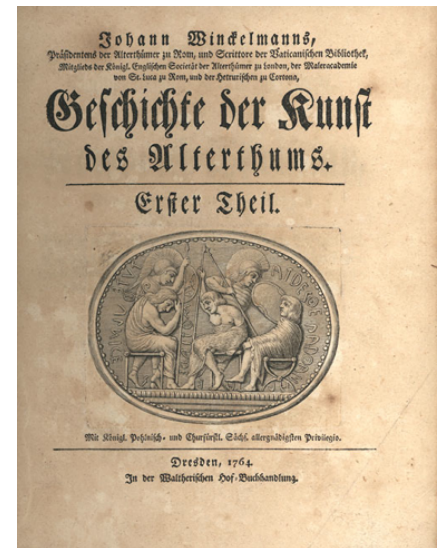
Figura 3. Anónimo. Portada del libro Geschichte der Kunst des Alterthums , (Historia del arte de la antigüedad). Esta obra de Winckelmann ha llegado a ser considerada como la obra fundacional del campo de conocimiento de la Historia del arte, fue publicada por primera vez ahora hace justo 250 años. 1764. Dresde Alemania. Recuperado de: http://upload.wikimedia.org/wikipedia/commons/6/68/Winckelmann_Geschichte_der_Kunst_des_Alterthums_EA.jpg De dominio público.

Sostiene que la armonía que agrada a la sensibilidad no se compone de innumerables elementos discontinuos, enlazados y afinados, por el contrario, es de rasgos sencillos y continuos. Este es el motivo que hace que un palacio sobrecargado de ornamentación parezca pequeño y una casa sencilla y bien edificada parezca grande (Winckelmann, 1764, p. 78). "La unidad y la sencillez hacen sublime toda belleza, así como ella hace sublime todo lo que hacemos o decimos, pues lo que es en sí grande, cuando se ejecuta