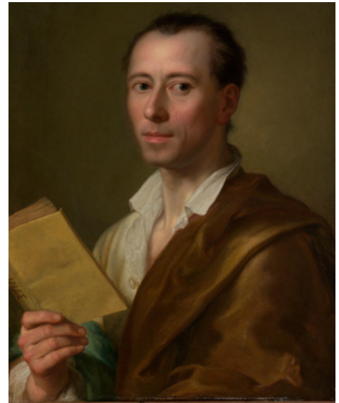
Figura 1. Anton Raphael Mengs. Retrato de Johannes J. Winckelmann. Esta pintura fue realizada por los lazos de amistad y mutua admiración por el arte clásico justo en los años en que Winckelmann alcanza el mayor reconocimiento internacional por sus historias del arte clásico. 1761 y 1762 La pintura original se encuentra en Metropolitan museum of art, Nueva York.

El conocimiento sobre los orígenes y la evolución de la Historia de la arquitectura, es decir, de este campo sub-disciplinar de estudio, es aún inexplorado, afirmación que se desprende al observar las publicaciones de las grandes editoriales del mundo hispanohablante. La historiografía general del arte reconoce al historiador alemán Johannes J. Winckelmann (1717-1768) como el fundador de la Historia del Arte, el cual dedicó parte de sus reflexiones a la cuestiones de la Historia de la arquitectura. Este primero de dos artículos se propone exponer dicho pensamiento pionero.