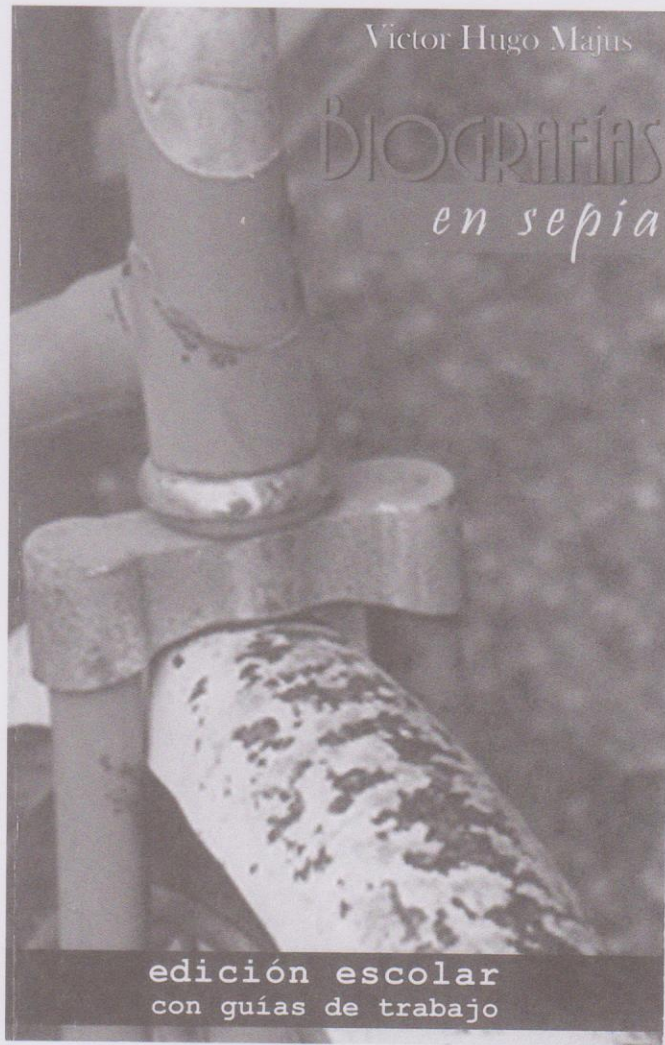
Portada del libro Biografías en sepia. Edición escolar, 2009