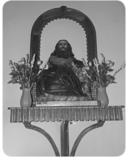
Imagen del Padre Eterno que se venera en el templo de Santa Rosa, zona 1, ciudad de Guatemala.

“no tiene tensión en las manos y su rostro es muy sereno. A diferencia, del Padre Eterno de Santa Rosa; que tiene gran dinamismo, aspecto majestuoso, ángeles en movimiento, cabello rizado ondulante y nubes, por lo que sí es barroco. El Cristo de San Sebastián está en agonía, pero también parece neoclásico, porque es muy limpio, no tiene la intensidad del sufrimiento ni la sangre de los barrocos. El Espíritu Santo es totalmente blanco, creo que, incluso, es posterior. También hay que considerar que pudo recibir retoques en 1959, pero no hubieran cambiado el rostro sereno del Padre, por lo que sigo insistiendo en que es más afín al neoclásico. Repito que, en todo caso, pudo ser modificado cuando se trasladó a San Sebastián”.