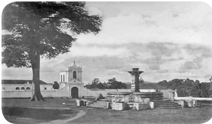
Fotografía de Eadweard Muybridge, fechada en 1875 en donde se observa la plaza e iglesia del antiguo pueblo de Jocotenango.

Indudablemente, una de las primeras acciones que se llevaron a cabo antes de la supresión de Jocotenango fue la destrucción de la iglesia parroquial. Bien es sabido, que los gobiernos liberales rechazaban las manifestaciones del catolicismo, razón por la cual es comprensible que se haya procedido a demoler el templo. Batres Jáuregui refiere que la iglesia fue destruida en 1874, sin embargo, existe una fotografía de Eadweard Muybridge fechada un año después en la cual se observa la ceiba, una fuente y al final la iglesia aun en pie. Posiblemente Batres Jáuregui confundió las fechas con 1879.