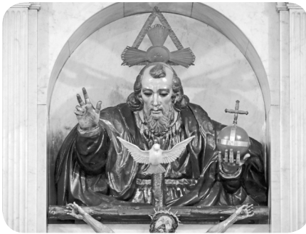
Detalle de la imagen del Padre Eterno, templo de San Sebastián, ciudad de Guatemala.