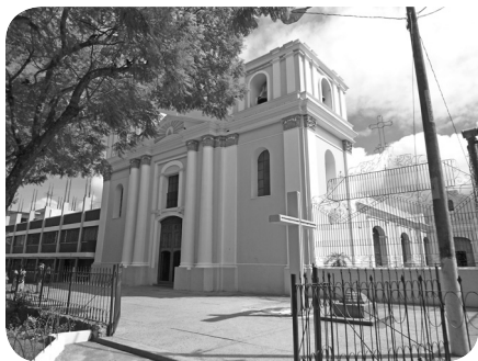
Fachada del templo de San Sebastián en la ciudad de Guatemala, sitio donde se encuentra la venerada imagen del Padre Eterno.

El 12 de enero de 1964, fue solemnemente inaugurada la nueva capilla del Padre Eterno, acto que fue dedicado a celebrar el 25 aniversario de la designación de Mariano Rossell y Arellano como arzobispo de Guatemala. El acontecimiento quedó documentado en las notas de varios periódicos de la época, al respecto: