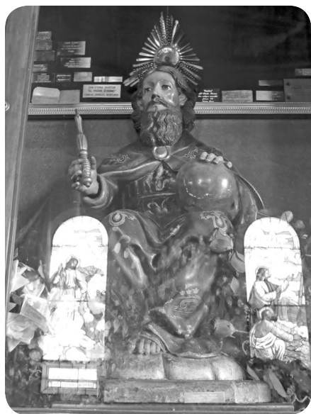
Imagen del Padre Eterno que se venera en la iglesia del barrio San Pedrito, zona 5, ciudad de Guatemala.

de la apertura de la iglesia de Santa Rosa, luego de la reconstrucción de los daños sufridos por el terremoto del 4 de febrero de 1976: “Se ha pedido invitar muy especialmente a la Eucaristía de esta noche, a los numerosos devotos de Nuestra Señora de los Desamparados y Padre Eterno que se veneran en aquella iglesia” ( El Imparcial , 14 de agosto de 1984, página 12).