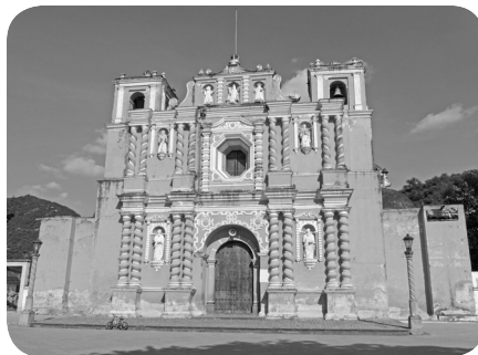
Fachada de la iglesia parroquial de Jocotenango en el departamento de Sacatepéquez

Por más de 250 años la vida de Jocotenango se desarrolló paralela a la de Santiago de Guatemala. En lo religioso pasó a ser cabeza de curato, existiendo en la población varias cofradías. Su actual iglesia parroquial data de la segunda mitad del siglo XVIII y es una excelente muestra del barroco guatemalteco. Sin embargo, las cosas estaban por cambiar.