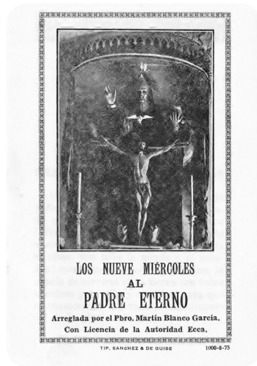
Portada de la oración de los nueve miércoles al Padre Eterno. Colección del autor

Con toda probabilidad la llegada al templo de San Sebastián de la imagen del Padre Eterno contribuyó a la consolidación de la devoción que ya se practicaba, misma que continuó en ascenso en el siglo XX, hasta llegar a constituirse en una de las más importantes del Centro Histórico de la ciudad de Guatemala.