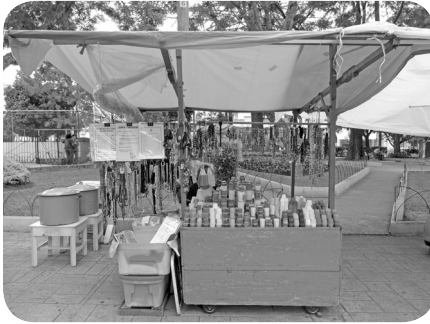
Venta de candelas, veladoras, novenas y otros objetos de culto en honor al Padre Eterno se encuentran en el atrio del templo de San Sebastián los días miércoles.

comunidad. Los vendedores que se instalan los miércoles deben obtener un permiso por parte de la Municipalidad de Guatemala para poder ofrecer sus productos. Frente a la iglesia se instalan personas en sillas de ruedas y adultos mayores, quienes esperan una limosna por parte de los fieles que visitan al Padre Eterno.