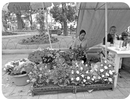
Venta de flores en el atrio de la iglesia de San Sebastián