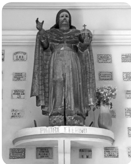
Imagen del Padre Eterno que se encuentra en la iglesia parroquial de Santiago Sacatepéquez, departamento de Sacatepéquez

Actualmente sobreviven algunas esculturas del Padre Eterno en sus diversas manifestaciones, ya sea como el Trono de la Divina Gracia o bien dentro de la Santísima Trinidad. Destacan entre otros el que se venera en la catedral de Los Altos en la ciudad de Quetzaltenango; en la iglesia parroquial de San Lucas Sacatepéquez; en Samayac y San Lorenzo (Suchitepéquez); así como en el Calvario de la ciudad de Chiquimula. Un caso particular lo constituye una imagen del Padre Eterno, que se encuentra en la iglesia parroquial de Santiago Sacatepéquez (Sacatepéquez), la cual aparece de pie, dando la impresión de protección y magnificencia.