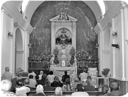
Capilla del Padre Eterno en donde sus devotos elevan oraciones y plegarias.

Se empezó la recolección de fondos, sin embargo, se tuvo que subsanar un problema con el decano de la Facultad de Farmacia de la Universidad de San Carlos de Guatemala. “La diferencia estribaba en que la Facultad alegaba que los cimientos de la capilla se habían entrado 5 centímetros en el terreno de la propiedad de la facultad” (Estrada Monroy, 1987: 76).