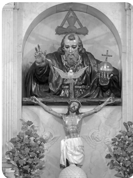
Imagen del Padre Eterno venerada en la iglesia de San Sebastián de la ciudad de Guatemala

Luego de la ruina de Santiago de Guatemala varias de las parroquias e iglesias que formaban parte de la ciudad fueron trasladadas al Valle de La Ermita, entre ellas la de San Sebastián, la cual fue bendecida en 1784 por el arzobispo Cayetano Francos y Monroy. En un inventario de 1804 se hace referencia que las imágenes y altares en la nueva iglesia quedaron distribuidos de la misma manera en que estaban en La Antigua Guatemala. En el mismo se hace referencia a un altar dedicado a la Santísima Trinidad también llamado El Padre Eterno (Estrada Monroy, 1987: 58).