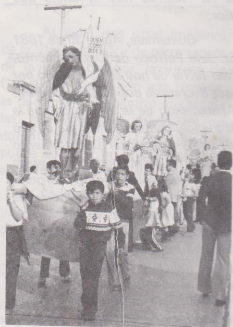
El "rezado" se realiza en los alrededores de la parroquia.

Los cambios introducidos por la Revolución Liberal de 1871 modificaron en alguna medida las diversiones y otros aspectos de las fiestas populares. Entre los aspectos