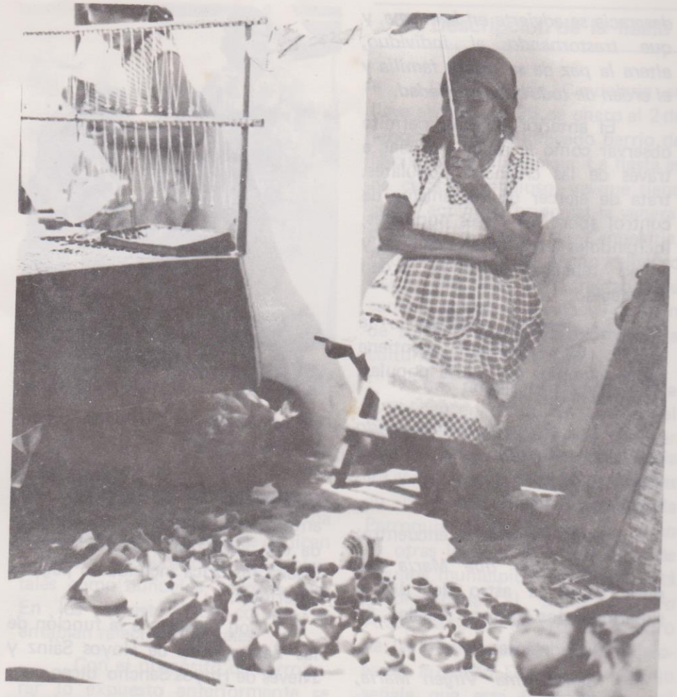
En 1982 se colocó en el atrio de la parroquia una vendedora de cerámica tradicional.

Señor mío Jesucristo, Dios y Hombre verdadero, Creador, Padre y Redentor mío, por ser Vos quien sois y por que os amo sobre todas las cosas, a mi me pesa, pésame Señor de todo corazón haberos ofendido, propongo firmemente la enmienda de mi vida, nunca más pecar, al apartarme de todas las ocasiones de ofenderos, el confesarme y cumplir la penitencia que me fuere impuesta, ofrézcoos mi vida, obras y trabajos en satisfacción de todos mis pecados, así como os lo suplico, así confío en vuestra divina bondad