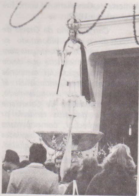
Nuestra Señora de Candelaria sale del templo.

dignos de mencionar está el que refiere a la supresión del municipio de Candelaria y su incorporación como barrio de la capital. Esta medida fue adoptada por razones de tipo económico.