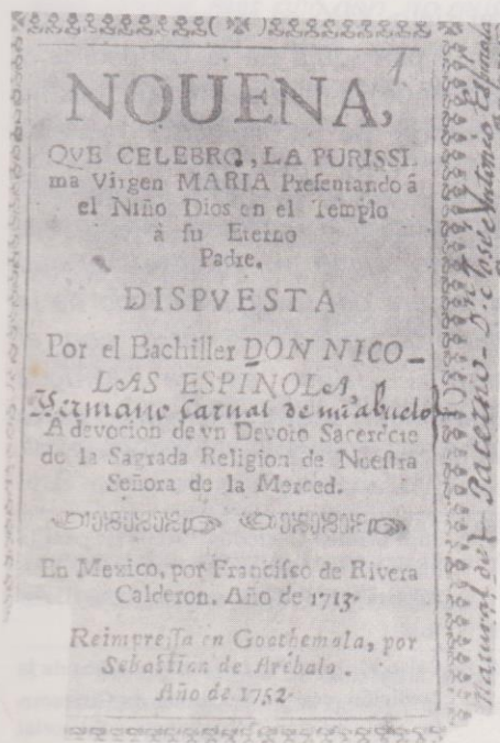
Portada de la "Novena a la Virgen de Candelaria", que se puede comprar en el atrio de la Parroquia.

La imagen de Jesús ocupó uno de los sitios preferentes en la iglesia 21