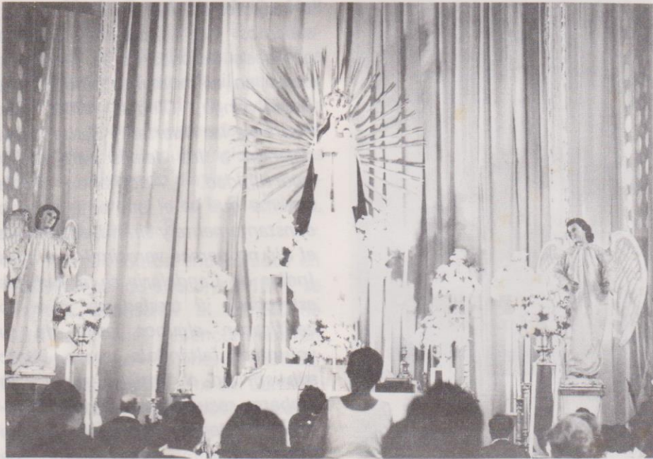
La imagen de la Virgen de Candelaria en el altar mayor de la parroquia del mismo nombre el día principal 2 de febrero.

ción de otra gente ladina, mestizos, mulatos y negros, a que se agrega otra y dilatada población que corre también a el Norte, y se extiende y trepa por la aspera subida y repecho de un monte hasta la medida del, á el modo que una nueva Toledo; que desde la fundación ha estado de indios ladinos poblada, y no con pequeña ni despreciable conveniencia, por ser todos aventajados y diestros oficiales en las artes de albañilería, carpintería y fundición de primorosas piezas... 12