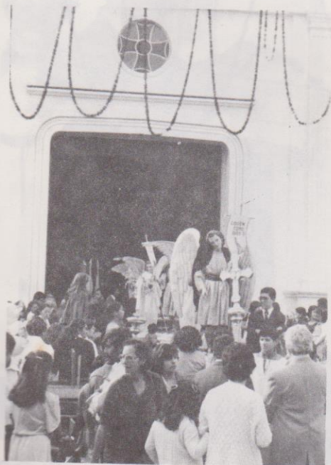
"El rezado" de Candelaria sale del templo.