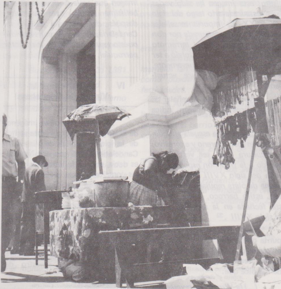
En el atrio de la parroquia de Candelaria se colocan ventas de comidas populares.

Lo anterior pone de manifiesto que el origen de las novenas debe