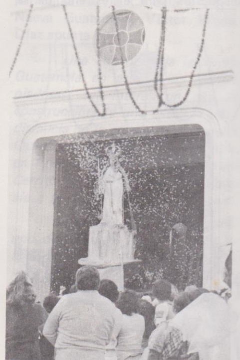
Los devotos arrojan pétalos de flores y confeti a la salida de la virgen.

(...) El Cantón de Candelaria se alza al Sur del anterior (se refiere al de la Parroquia, N. de la A.), entre el Central al Occidente y Mediodía a las parcelas llamadas de Colón, La Esperanza y terrenos del Fuerte de Matamoros al Oriente. Contiene cuatro Avenidas principales: la de Caballería, la de Candelaria, la del Golfo, hoy de Los Arboles, y la de San Francisco, esta última atravesada en toda su longitud por el Ferrocarril del Atlántico. Al Oriente de esta Avenida se encuentra el sitio llamado la Morena. Pero la parte más interesante de este Cantón es la colina llamada Cerro del Carmen, en donde se ha reconstruido la Ermita de este nombre, que era una joya que nos legara la Colonia... 29