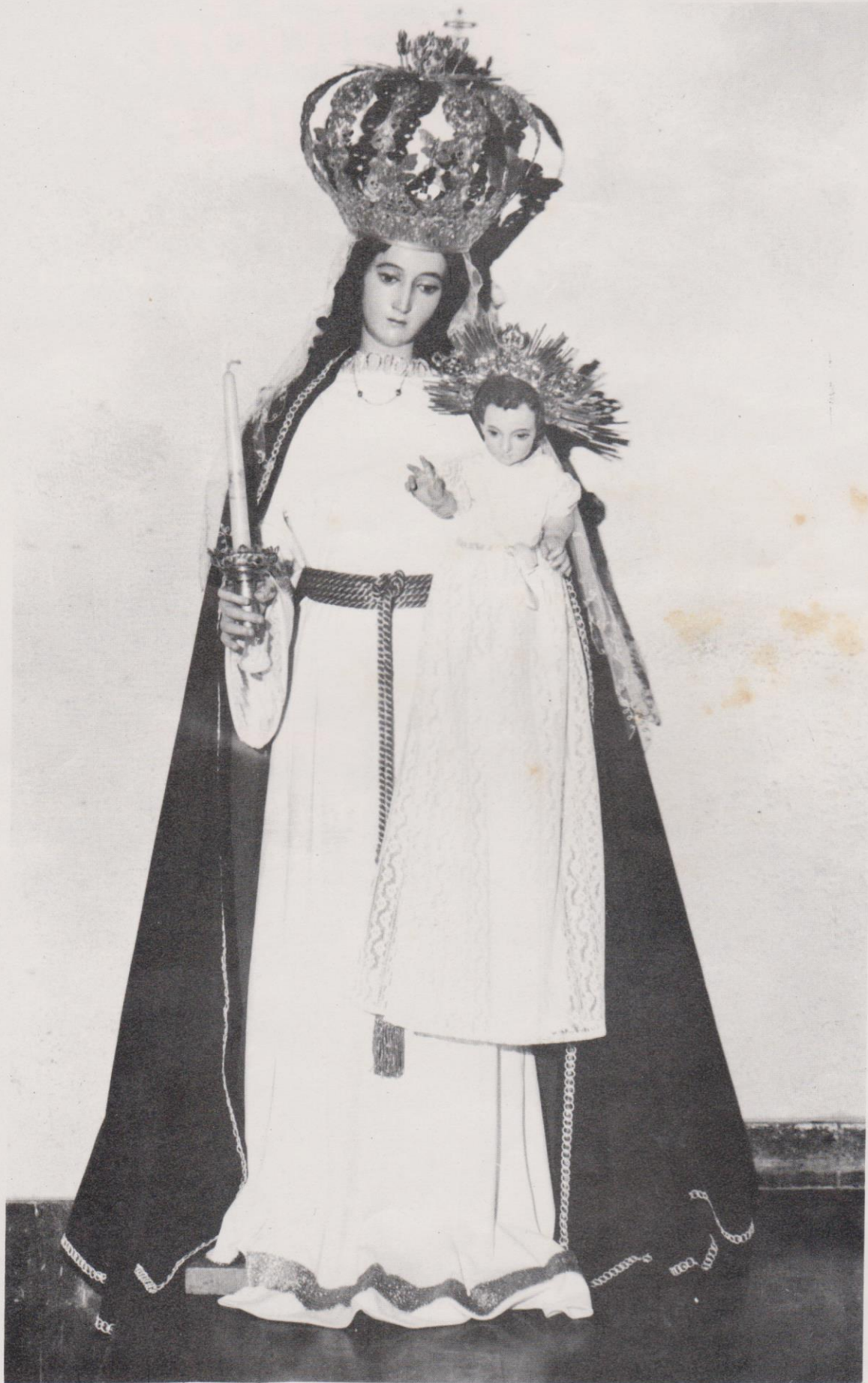
Imagen de la virgen de Candelaria que se encuentra en la Parroquia del mismo nombre, situada en la zona 1 de la ciudad de Guatemala.