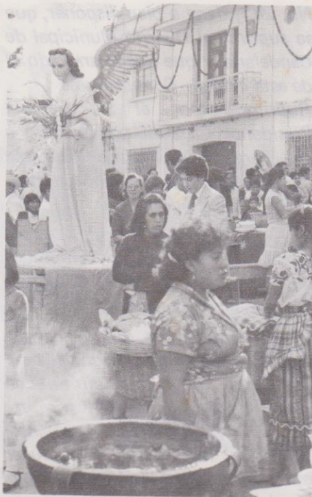
La procesión va precedida por ángeles.

Según datos encontrados en artículos periodísticos, en 1861 se dispuso reconstruir el templo de Candelaria pues se encontraba en mal estado; las imágenes se trasladaron a la iglesia del Cerro del Carmen. Los trabajos de reconstrucción duraron siete años, bajo la dirección del arquitecto Julián Rivera, estando la parroquia a cargo del presbítero José Pisana. Se señala, además, que la obra contó con la protección del presidente Rafael Carrera, quien nació en el barrio y fue bautizado en la parroquia. La reconstrucción fue concluida en 1867 y las imágenes retornaron al templo. En esta época era párroco el presbítero Manuel Zelaya, quien planificó las actividades del festival dispuestos para el estreno de la