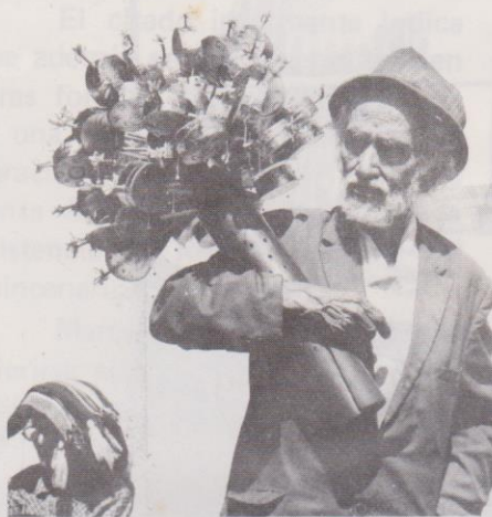
Un vendedor de "forlones" o tamborcitos.

La fiesta de la Virgen de Candelaria es considerada una de las más importantes y tradicionales de la ciudad de Guatemala, ya que se celebra en uno de los barrios más antiguos y populares de la Nueva