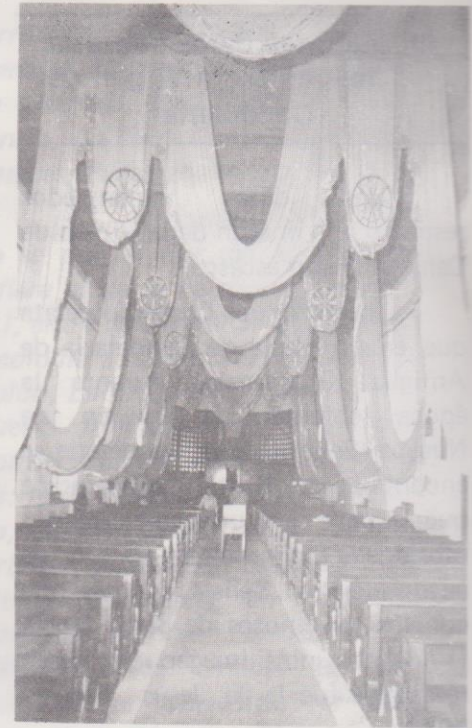
Interior del templo de Candelaria, pueden observarse los cortinajes.

fueron escritos por frailes, religiosos y sacerdotes, pero que generalmente —tal vez por voto de humildad— no firmaban sus obras, algunas muy buenas y excelentes tanto en el contenido como en la forma. De modo que el nombre de