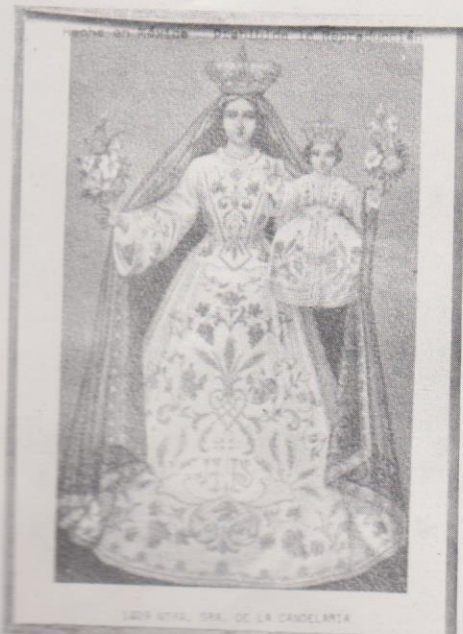
En las ventas de oraciones y cuadros de santos se puede adquirir cuadros como éste de la Virgen de Candelaria.

Existen numerosas leyendas y creencias en torno a las imágenes que representan a la Virgen o a otros santos de la iglesia católica. A continuación se cita una interesante leyenda de tipo histórico que se refiere a la Virgen de Candelaria y que data de la época de Rafael Carrera, quien era devoto de dicha imagen. (debe recordarse que la Batalla de la Arada, en la cual triunfó el ejército guatemalteco al mando de Carrera, se realizó precisamente el dos de febrero de 1851).