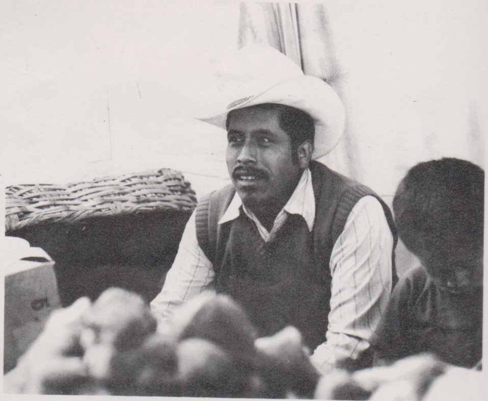
Algunos comerciantes, en especial los de Comalapa, Chimaltenango, van de feria en feria.