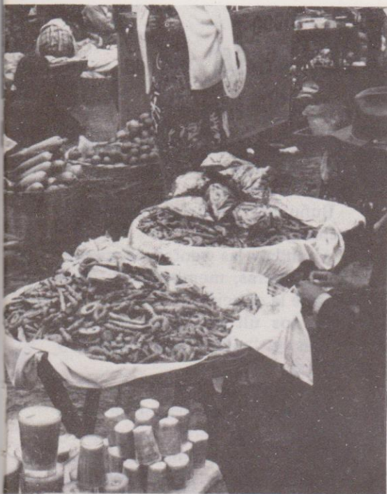
Existen numerosos vendedores de los tradicionales "panitos de feria" (Chimalteango).

cómo se celebraba en otras épocas, lo cual se puede constatar con la lectura de las crónicas incluidas en el presente trabajo.