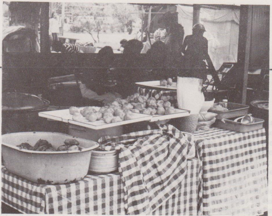
En los "Comedores populares" no faltan las torrejas, ni los buñuelos.

se extiende de los niños a las señoritas y a las señoras, y de éstas al grande ejército del dandysmo..." 13