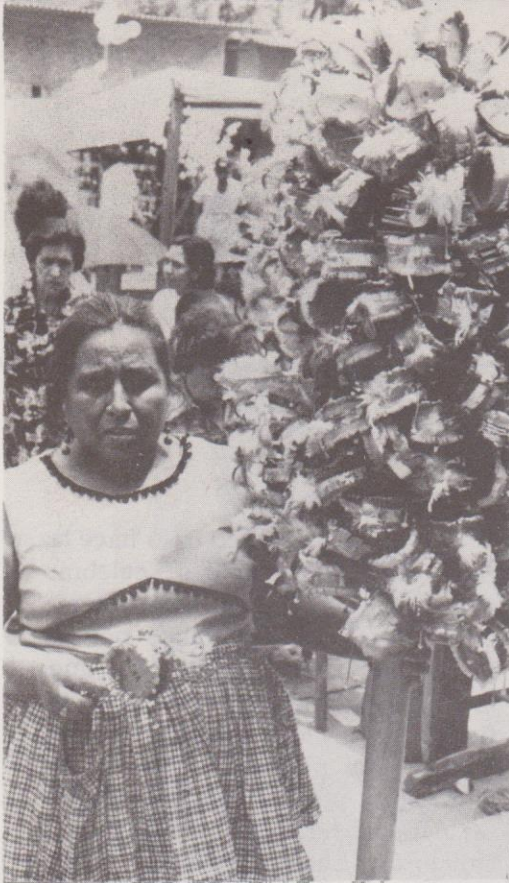
En el "Corpus de Catedral" se encuentran algunos vendedores de "tamborcitos".