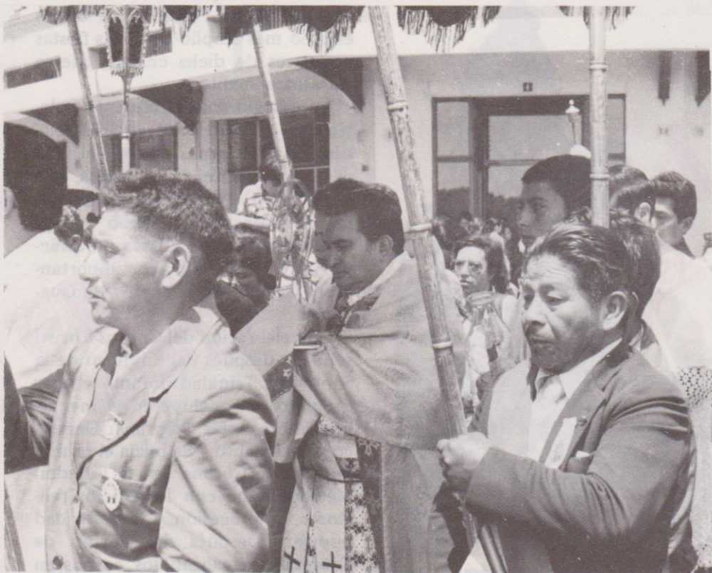
Bajo el palio el sacerdote porta el Santísimo Sacramento en custodia.

En 1262 Urbano IV emite una bula en la cual se establece la celebración del Corpus Christi como fiesta de precepto. Designa para esta festividad el jueves de la octava de Pentecostés. Clemente V confirma en el Concilio de Viena, en 1311, la bula mediante la cual Urbano IV instituía la celebración del Corpus. Lo mismo hizo el papa Juan XXII, cinco años más tarde. Santo Tomás de Aquino compuso el oficio de la Misa del día de Corpus.