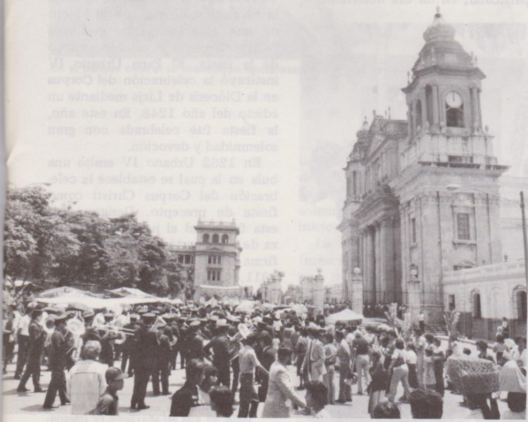
Vista panorámica de la procesión del "jueves de corpus", a su retorno a la Catedral Metropolitana.

La celebración del Corpus Christi se inicia después del domingo de la Santísima Trinidad durante el mes de junio, y concluye en el mes de noviembre, antes del primer Domingo de Adviento. Se inicia el primer "jueves de Corpus" en la Catedral Metropolitana con los oficios religiosos, la procesión y la festividad popular. Después del Corpus de Catedral se realizan los corpus en las demás iglesias de la Diócesis.