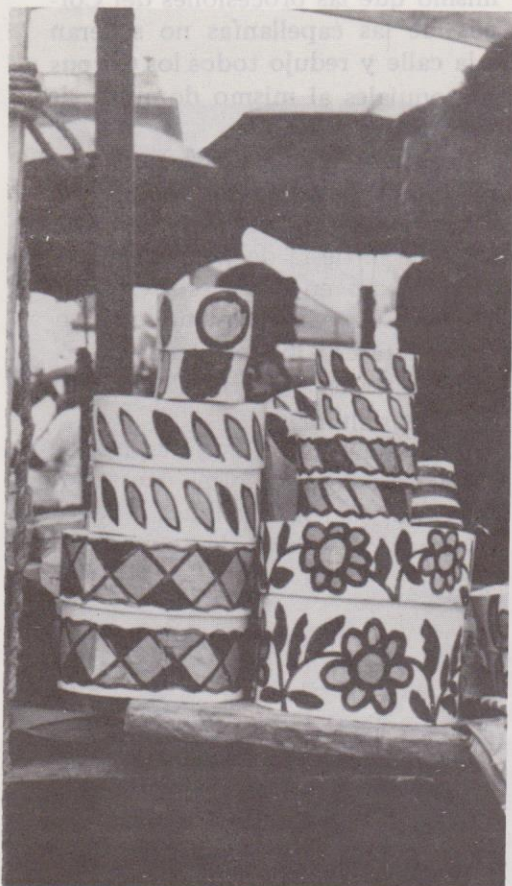
En el "Corpus" hay algunas ventas de dulces de Amatitlán (Guatemala).

De manera general, puede afirmarse que la celebración del Corpus Christi en la mayoría de poblaciones urbanas ha variado. Tal es el caso de la ciudad de Madrid, en donde la celebración contaba con la participación de altas autoridades; se presentaban autos sacramentales y desfilaban personajes tradicionales como la tarasca y los gigantes. En la actualidad, solamente se efectúa una procesión cívico-religiosa custodiada por filas de tropa, lujosamente ataviadas, que vigilan su paso. 16