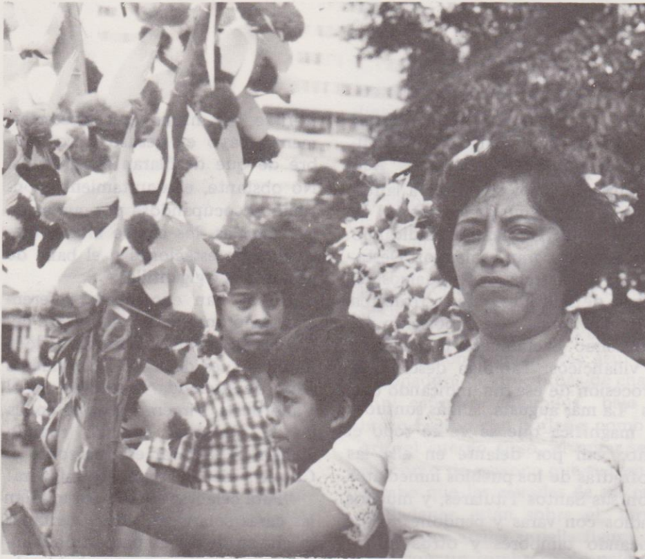
En el parque central se encuentran numerosas vendedoras de "palomas".

El Año Cristiano indica que una de las características esenciales de esta festividad y lo que la distingue de las otras, lo constituye la solemne procesión del Corpus, cuyo inicio se atribuye al Papa Juan XXII. 2