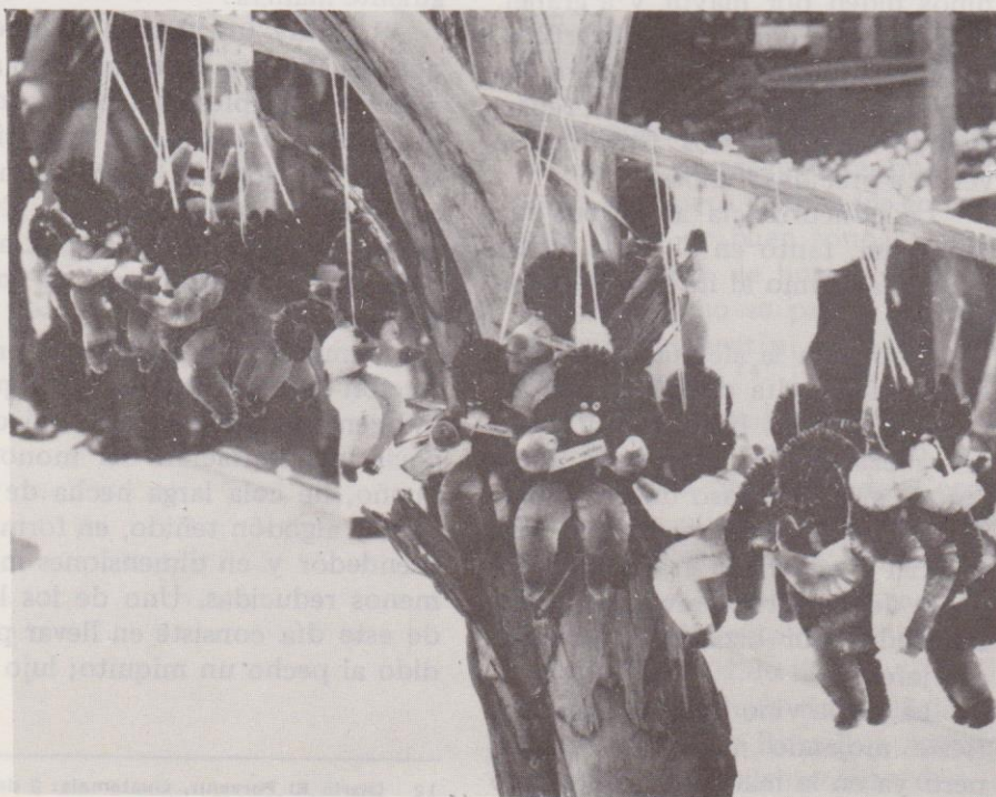
Un vendedor de “micos” o “changos” de cerdas y alambre.

—Cómprame la tortuga, gritaba la otra y los patojos también vociferaban: micos, micos presentan do una colección de cuadrumanos en miniatura fabricados de diversos materiales.