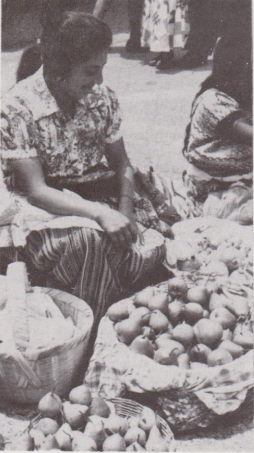
Los tradicionales membrillos y peras de la estación.

El simbolismo de estos animalitos aún no ha sido estudiado, pero es probable que posea elementos de carácter sexual.