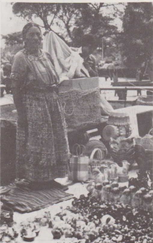
En el piso de la calle se colocan vendedores de cerámica tradicional.

Porque eso sí, hay micos de varias categorías y clases: de hueso fabricados con sumo esmero y más paciencia por los pobres presos, de papel, de madera y los micos importados —quién lo creyera siendo aquí la tierra de ellos— que son de algodón.