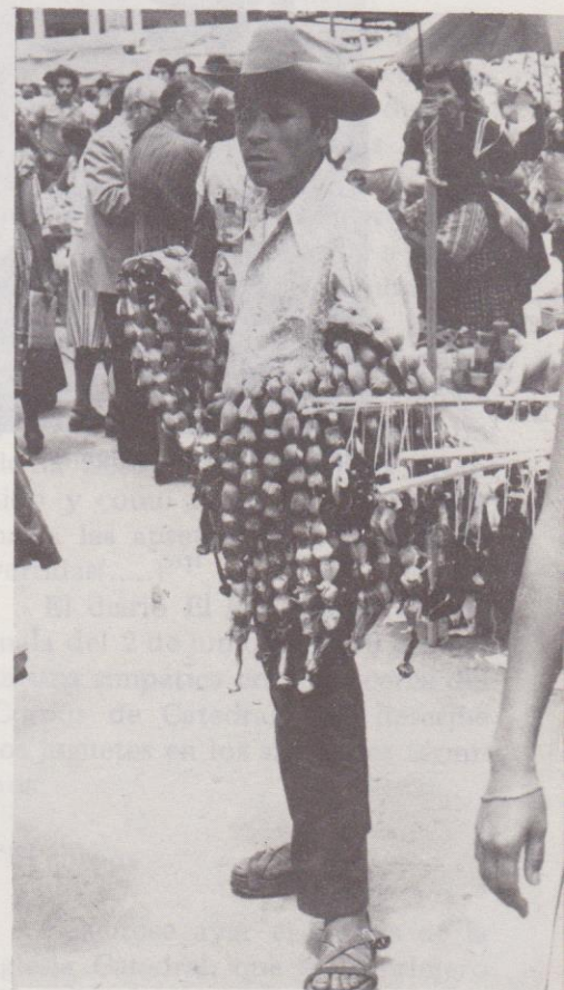
Frente al atrio de la Catedral, en la calle, se colocan vendedoras de "palomas" y "micos", así como de artículos no tradicionales.

venden por esos mismos tiempos. Los micos, los forlones y los birloches, el gigante que tan pronto pone su cabeza sobre la planta de los pies como vuelve a su lugar, todo eso lo conocimos nosotros(.....)" 8 (El subrayado es de la autora).