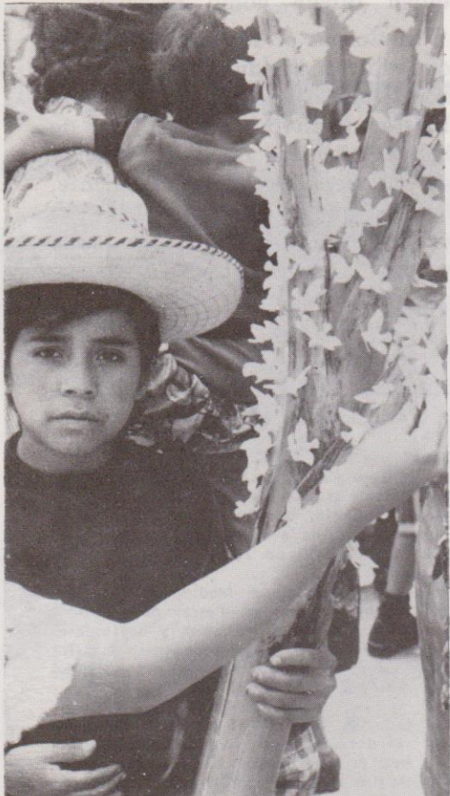
Un vendedor de "palomas" y "micos".