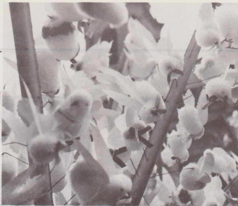
Un palo lleno de "palomas".

A través de la crónica anterior es posible conocer el tipo de gente que asistía al Corpus en la época a la que se refiere Salazar (Régimen de los Treinta Años). Mediante su lectura se aprecia que concurrían a esta festividad numerosas personas pertenecientes a las clases alta, media y clases populares. Además, el texto describe los juguetes que se podían obtener en las ventas populares, de los cuales aún hoy es posible comprar algunos, tales como los micos, los forlones y el payaso de madera o "volatín".