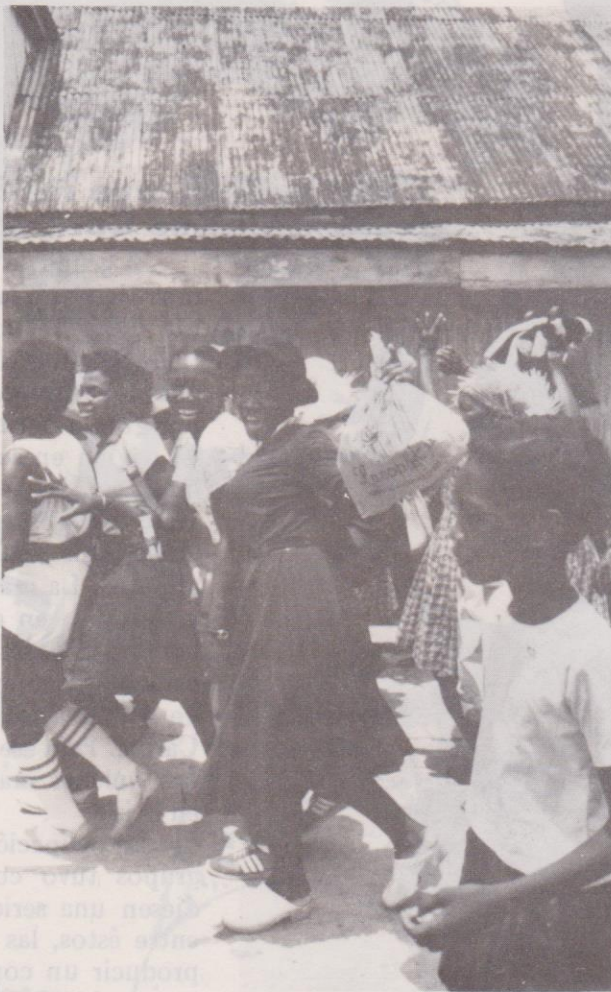
Pobladores Garífuna procedentes de Puerto Barrios y otros lugares, a su arribo a Livingston recorren las calles de la población.

(término con que se designó a la mezcla entre caribes rojos y negros africanos), terminaron por absorber y vencer a sus compañeros de territorio, los