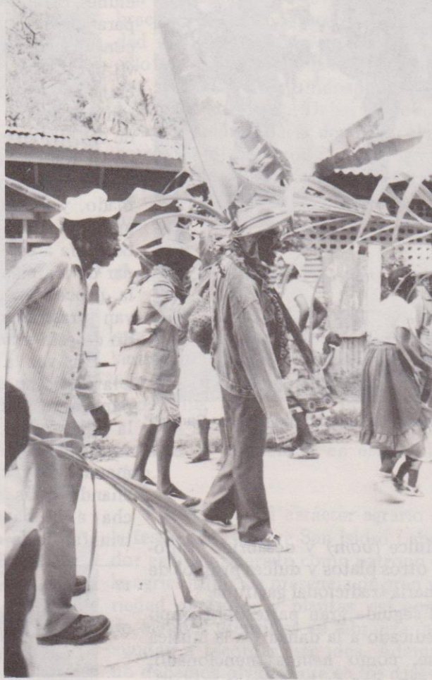
Los garífuna en la representación del arribo de los primeros pobladores el 15 de mayo en horas de la mañana, día de San Isidro Labrador.

No podemos dejar de mencionar la venta de refrescos y alimentos en las calles. Los vendedores se instalan desde el inicio de la festividad hasta el final. Debido a que los pobladores se dedican de lleno a celebrar al patrono, las actividades domésticas muchas veces son suspendidas y es aquí donde las ventas cumplen una gran función. Entre las bebidas podemos mencionar: horchata, tamarindo y rosa de Jamaica; entre los platos: tapado, rains and beans, enchiladas, chao mein, machuca, bocadillo de coco, piña, pan de