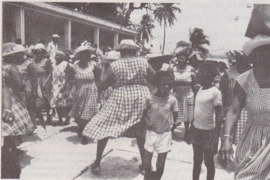
Marcha y baile de los distintos clubes por las calles de Livingston, durante la víspera de la festividad de San Isidro Labrador (14 de mayo, en horas de la mañana).