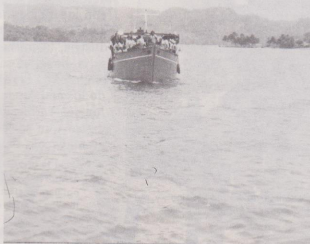
Arribo del vapor a Livingston con miembros del Club Amistad, procedente de Puerto Barrios.

A pesar de que la isla se encontraba dividida entre caribes rojos y negros africanos, las continuas luchas y ataques por parte de los franceses e ingleses (1719-1793) coadyuvaron a que estos grupos (caribes y negros) se fortalecieran entre sí. Sin embargo, a través del tiempo los caribes-negros