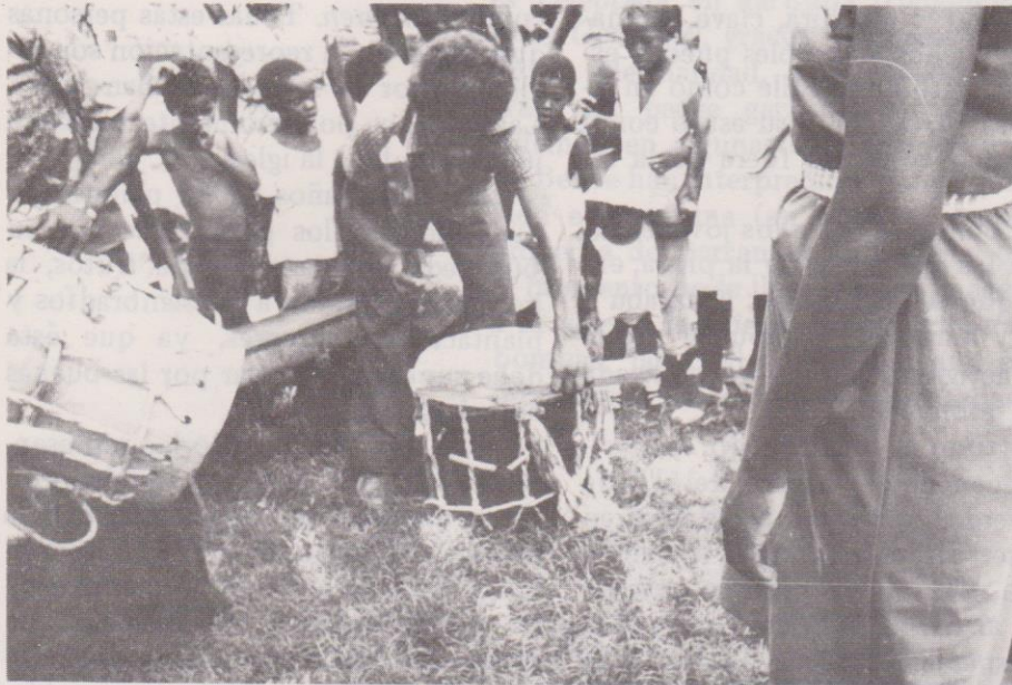
Músicos Garífuna afinan sus garaons (tambores) a través del tensado de la membrana.

to. 11 En el interior de la Hermandad se encuentra un gran movimiento. Los miembros de ésta obsequian café, tamal y pan a los visitantes. Algunos de éstos buscan dónde acomodarse en la Hermandad, para pasar la noche acompañando a la imagen. En estos momentos la Hermandad desarrolla una sesión con el objeto de dar la bienvenida a los visitantes, saludar al patrono y comentar el desarrollo de la festividad. Es común, durante estos momentos, observar a la gente rezando y pidiendo al santo patrono por el bien de las cosechas.