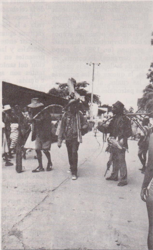
Detalle de la representación del arribo de los primeros Garífuna a Labuga (Livingston).

coco dulce ( bom ) y desabrido, topolios y otros platos y dulces propios de la culinaria tradicional garífuna.