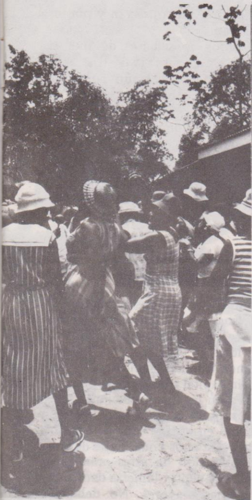
La población Garifuna camina y baila por las calles de la población durante la festividad.