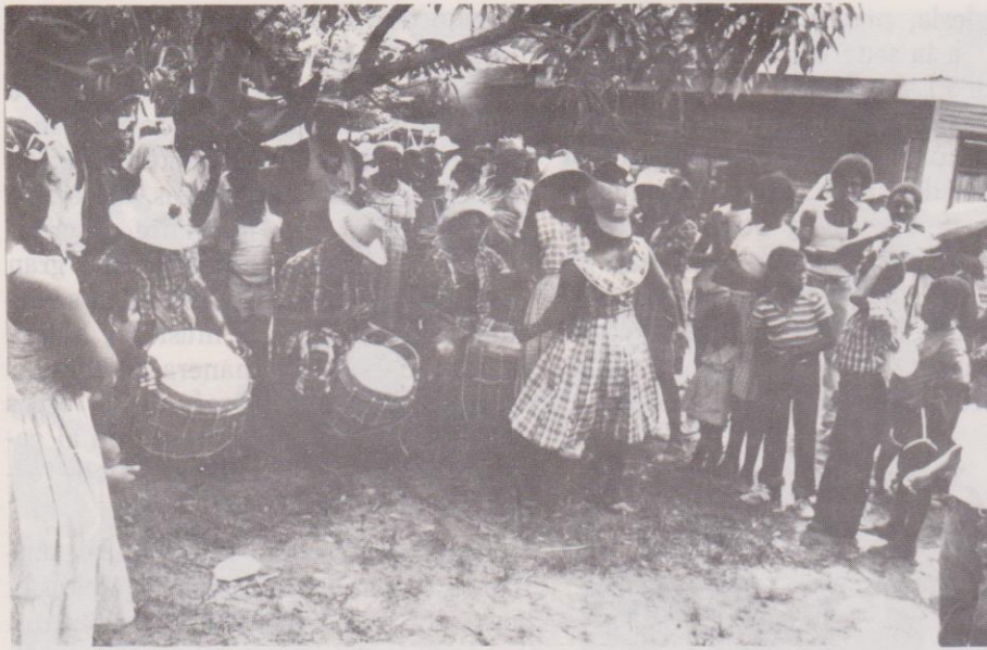
Los pobladores Garífuna danzan punta en el patio de la hermandad de San Isidro Labrador.

sede de la Hermandad, donde permanecerá hasta el día 15 de mayo.