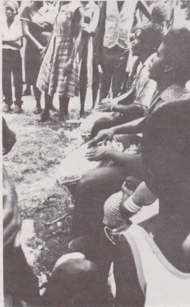
Detalle de músicos garífuna ejecutando el garaón (tambor) para la danza de la punta.

Una vez llegada la noche, el ambiente festivo invade todo el pueblo, y hasta los pobladores de las comunidades más lejanas acuden al pueblo con el objeto de recrearse por unos momentos, y sobre todo, visitar al san-