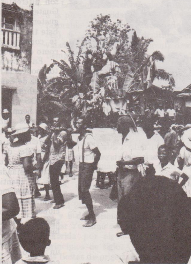
Procesión de San Isidro Labrador durante la mañana del 15 de mayo.

Esta hermandad fue fundada por "La Sociedad de la Agricultura" el 9 de julio de 1892. 6 Desde ese entonces se celebra la fiesta del mencionado santo y con sumo júbilo y devoción los trabajadores de la tierra elevan sus oraciones pidiendo a San Isidro buenas cosechas. A pesar de que esta hermandad no es tan numerosa, como otras de la comunidad, recae en ella la organización de la fiesta de San Isidro Labrador. Vale distinguir que la hermandad tiene tierras que son trabajadas por sus miembros.