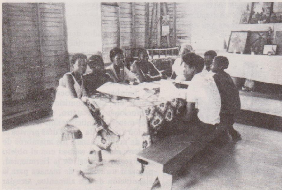
Miembros de la hermandad de San Isidro Labrador sesionan en su local para la preparación de la fiesta.

más de estar ligadas a la iglesia católica. Los miembros de una hermandad se llaman a sí mismos "hermanos", existiendo entre éstos un alto grado de solidaridad. La característica más sobresaliente de esta asociación es la ayuda mutua, especialmente en caso de muerte de uno de los miembros o por enfermedad, necesidad económica, etc.