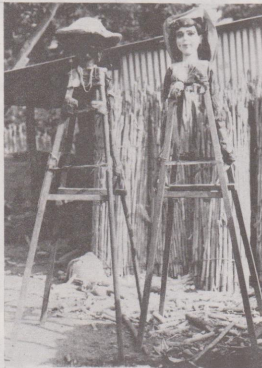
Gigantes, negra y blanca, de Sto. Domingo Xenacoj. Nótese los detalles de sus armazones.

Sí es cierto, en cambio, que el Baile de Gigantes resulta un divertimento popular auténtico, cuya función social radica en el carácter lúdico y representativo que asume en el interior de las poblaciones cakchiques de Guatemala.