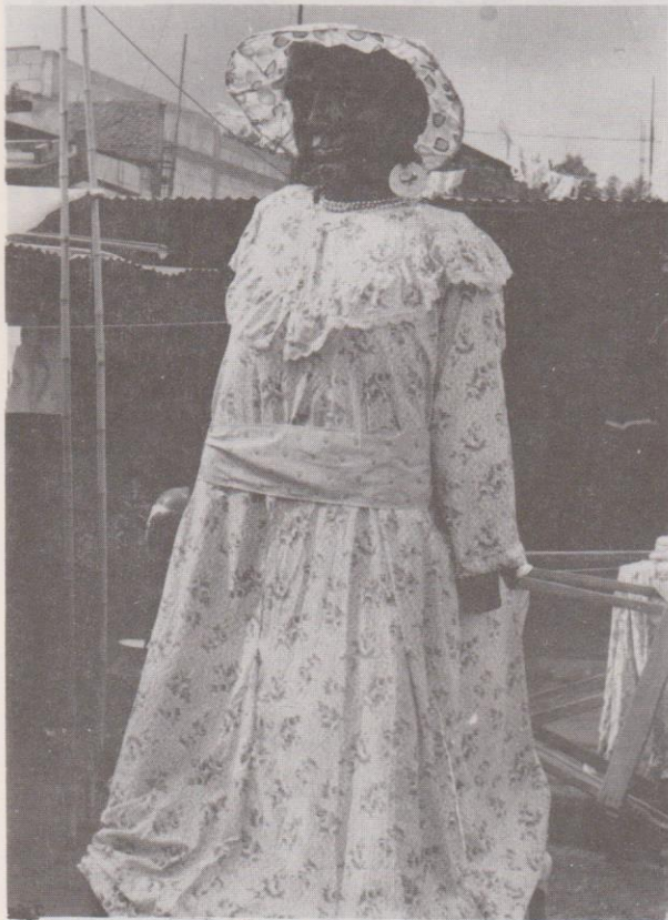
Giganta negra en Sumpango el 28 de agosto de 1985, lista para ser bailada ese día de la fiesta titular.