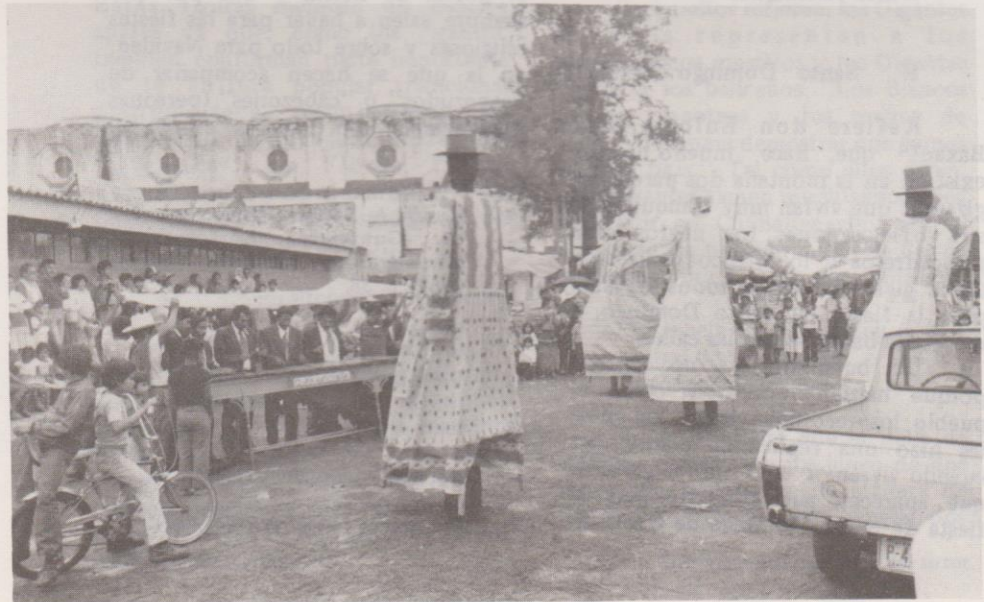
El Baile de Gigantes en Jocotenango el 15 de agosto de 1985.