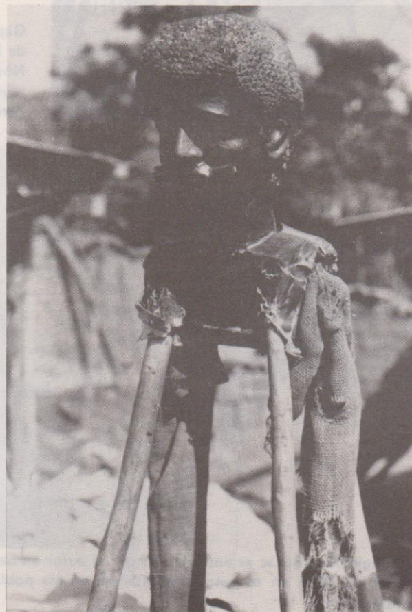
Gigante negro de Sto. Domingo Xenacoj. Nótese los detalles superiores de la armazón.