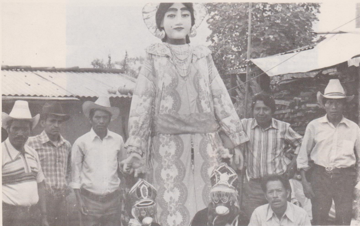
Representantes y bailarores de los Gigantes de Sumpango. Nótese la presencia de dos gracejos (micos).

Estas figuras merecen un estudio aparte ya que, como los gigantes, también conforman parte importante de la cultura popular tradicional guatemalteca. Asimismo se ha detectado la presencia de una "giganta", en Flores, Petén, denominada popularmente "La Chatona", objeto de estudio en un próximo boletín del CEFOL.