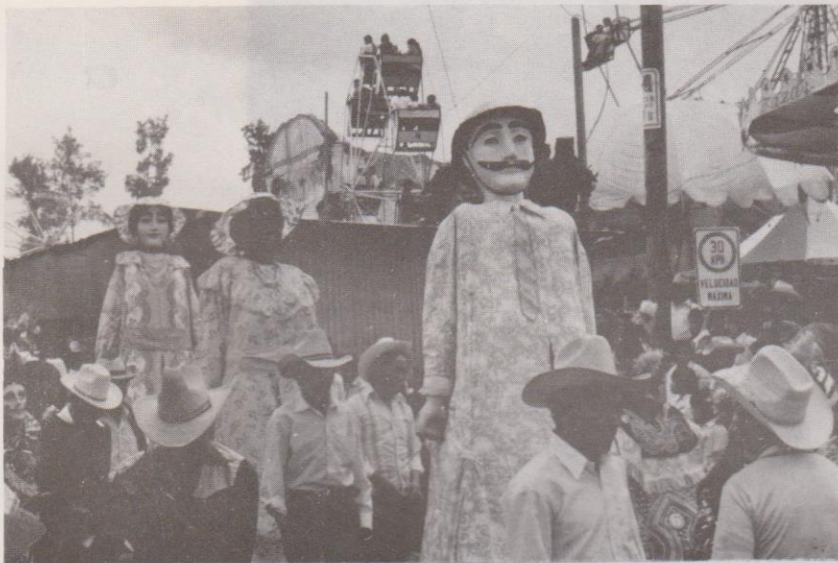
Baile de Gigantes en Sumpango el 28 de agosto de 1985.

personas blancas y dos negras o de origen africano. Hasta el momento se desconoce la causa de esta disposición, pero no cabe duda de que estas imágenes fueron recibidas con asentimiento popular, asimiladas y folklorizadas durante largas décadas de los siglos XVIII y XIX. Ma. Inmaculada Jiménez afirma que el hecho de que los gigantes sean negros y blancos "supone la sumisión y adoración a Dios de todas las criaturas de la tierra." 17