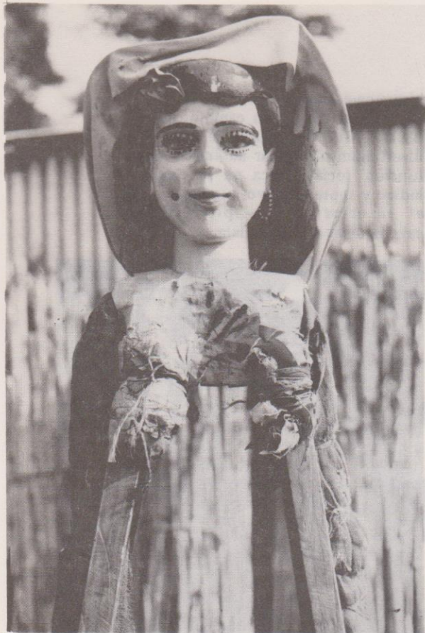
Giganta blanca de Sto. Domingo Xenacoj. Nótese los detalles superiores de la armazón.