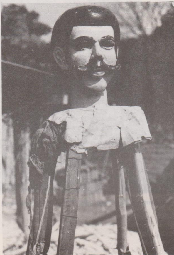
Gigante blanco de Sto. Domingo Xenacoj. Nótese los detalles superiores de la armazón.