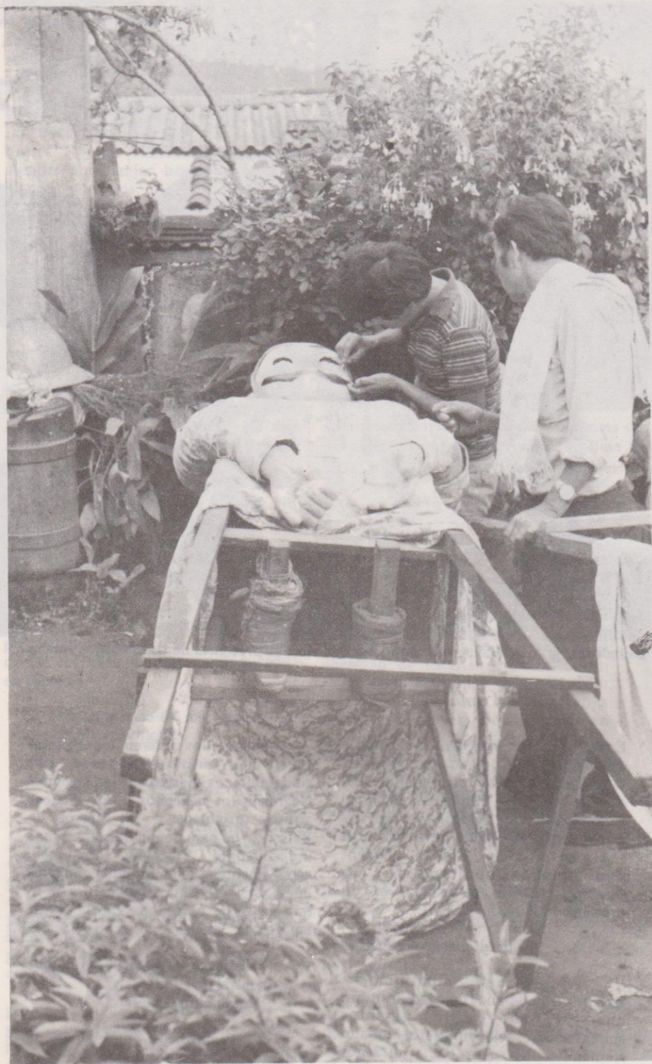
Reparando detalles del Gigante blanco en Sumpango el 28 de agosto de 1985.