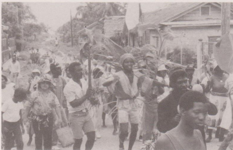
Garinagu en plena celebración del Yurumein en Livingston, Izabal para la Fiesta en San Isidro Labrador.