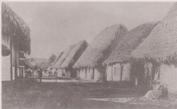
Vista de una calle del pueblo de Livingston. Pueden apreciarse las características arquitectónicas de la vivienda. (Suponemos que se trata de la calle principal).*