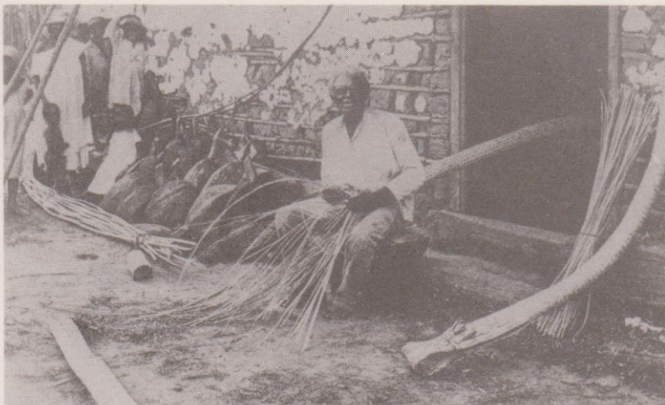
Artesano de la cestería, fabricando un "RUGUNA", utensilio usado para extraer el amargo a la yuca que será usado por el casabe.*