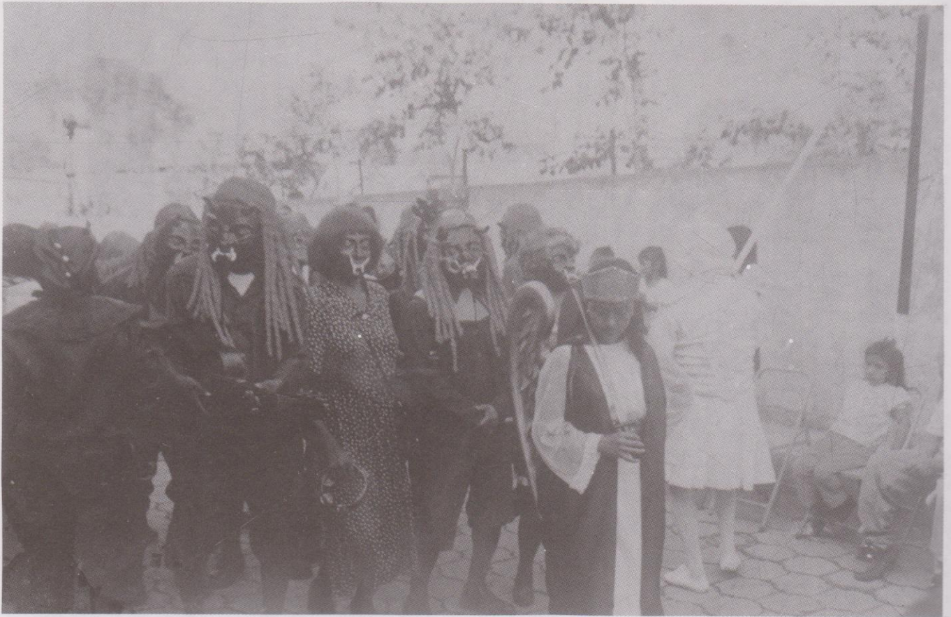
La Legión en el final de la Danza La Legión de los 24 Diablos. Ciudad Vieja, Sacatepéquez.