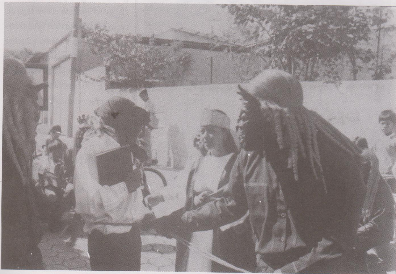
El Arcángel San Miguel y el alma apresada por el Diablo Codicioso, en la Danza La Legión de los 24 Diablos. Ciudad Vieja, Sacatepéquez.