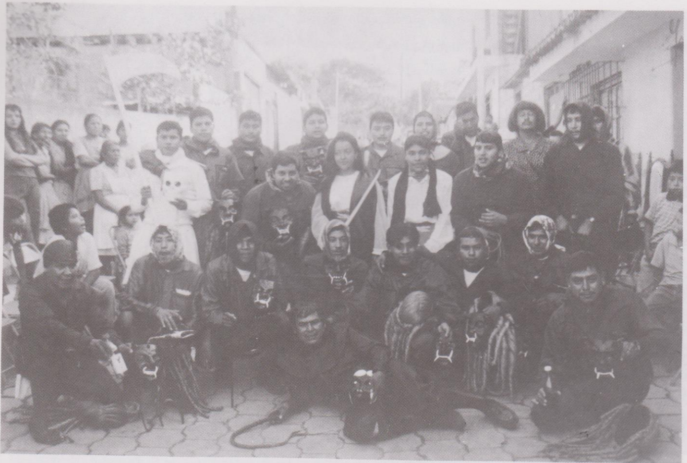
Miembros del baile La Legión de los 24 Diablos. Ciudad Vieja, Sacatepéquez.