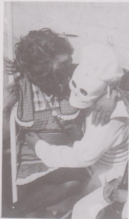
La Muerte y La Criada en la Danza La Legión de los 24 Diablos. Ciudad Vieja, Sacatepéquez.

de Alvarado la traslado. Fue destruída por una correntada que bajó del Vólcán de Agua, unida a un terremoto del Volcán de Fuego en la Noche del 10 al 11 Sep. de 1541. El Topónimo Almolonga continuó aplicándose al lugar que estaba entre las faldas del Volcán de Agua.