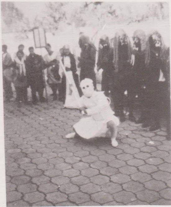
La Muerte: símbolo del mal dentro del contexto de los 24 diablos.