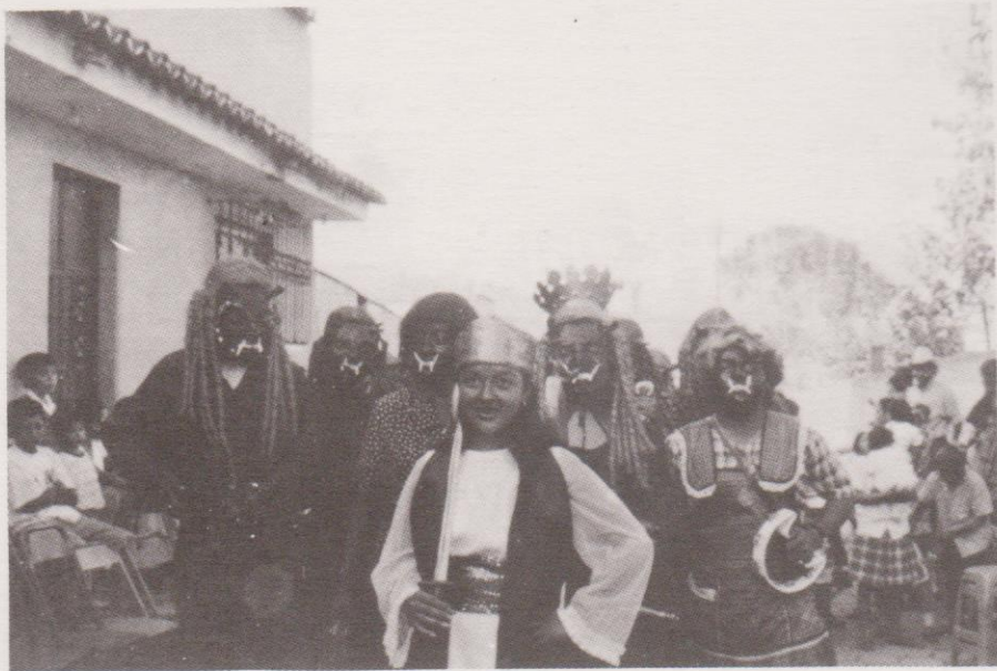
Música de despedida de finalización del baile La Legión de los 24 Diablos.