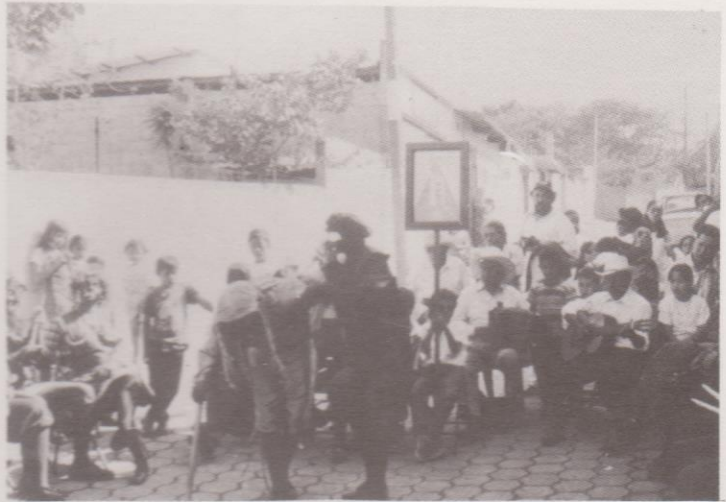
El Diablo verde con el Mico Gracejo, en la Danza La Legión de los 24 Diablos. Ciudad Vieja, Sacatepéquez.