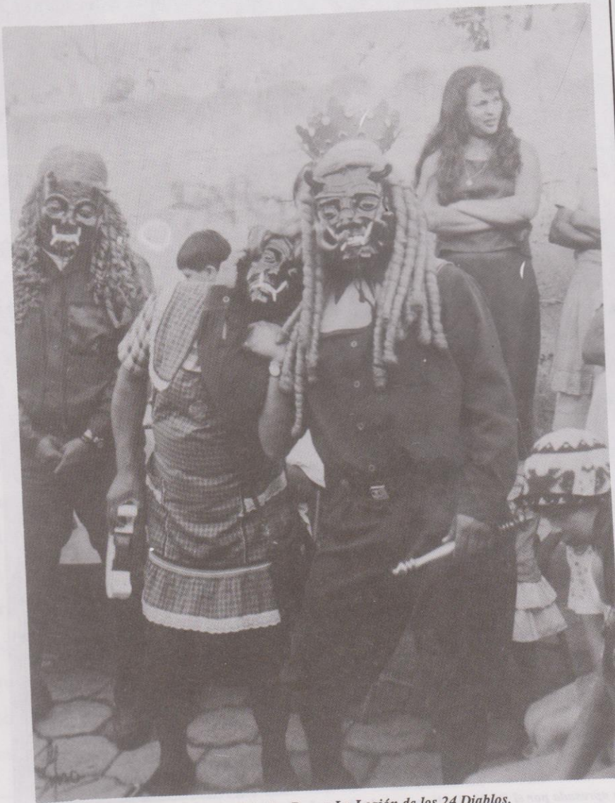
Diablo Mayor y la Criada. Danza La Legión de los 24 Diablos. Ciudad Vieja, Sacatepéquez.

Este baile es una de las danzas que tradicionalmente se celebra en los pueblos de Guatemala, en las fiestas patronales, en este caso como ya se mencionó aparece para el día de la Virgen de Concepción en el municipio de Ciudad Vieja Sacatepéquez.