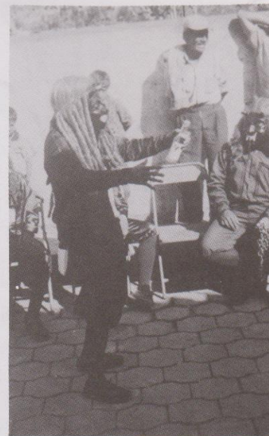
El Borrachín con su parlamento, en la Danza La Legión de los 24 Diablos. Ciudad Vieja, Sacatepéquez.

Revista No. 50, Tradiciones de Guatemala. Cefol-Usac "La Oralidad"