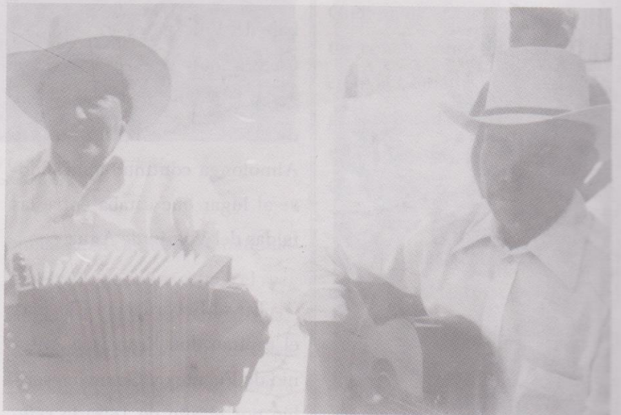
Musicos acompañantes en la Danza La Legión de los 24 Diablos. Ciudad Vieja, Sacatepéquez.

La legión de los 24 Diablos en el texto danzario, el cual vincula el movimiento por medio de sus parlamentos, como punto de referencia es una expresión que nos lleva a visualizar sus movimientos como referente histórico, los cuales pueden identificar formas estéticas dentro de la tradición popular del baile; como apunta Carlos René García Escobar 6 : “Las danzas se presentan desde las ejecuciones más senc-