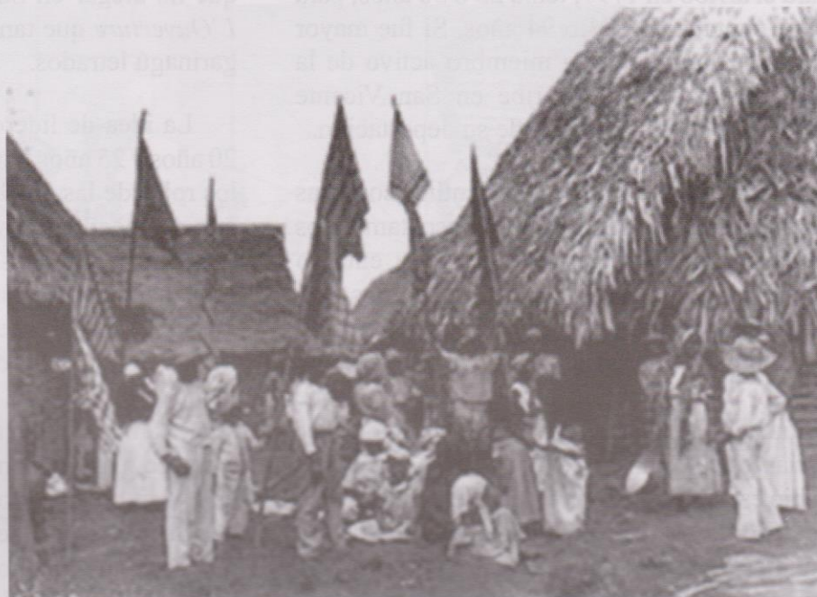
Garínagu de Livingston, 1901.

músicos). Dado que se encuentran dentro de la fiesta de San Isidro Labrador (15 de mayo), existen intersecciones con la tradición judeocristiana. 20 Pero se trata de una celebración que da sentido de autonomía, que afirma al subgrupo del asentamiento, como sucede con los otros. 21