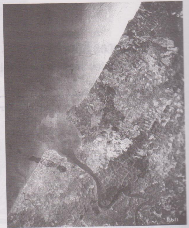
Fotografía Aérea de la Desembocadura del río Dulce y el Puerto de Livingston.