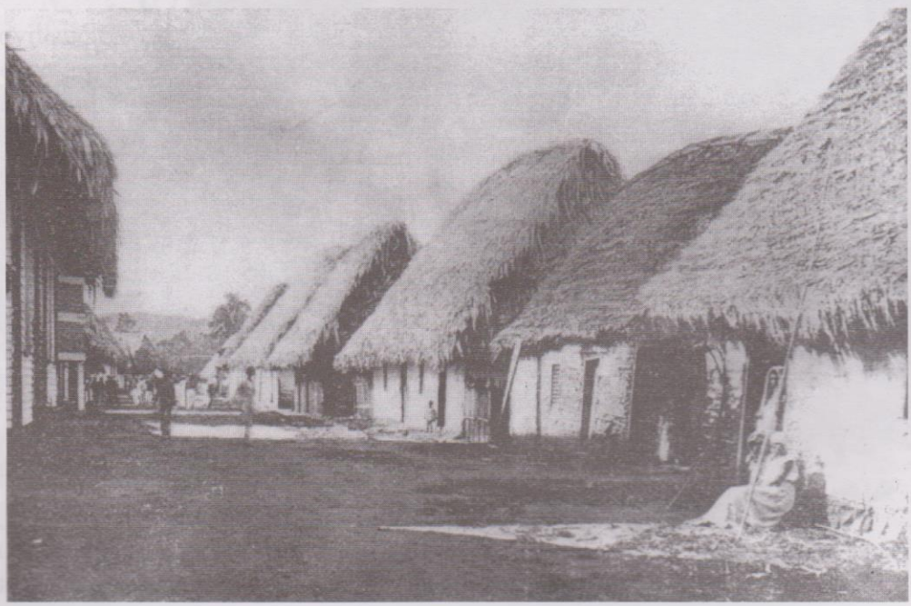
Calle Principal del Puerto de Livingston, a finales del siglo XIX. Brigham A.M. William T Guatemala The Land of the Quetzal. 1887, London.

A la memoria de los fundadores de los pueblos de la costa.