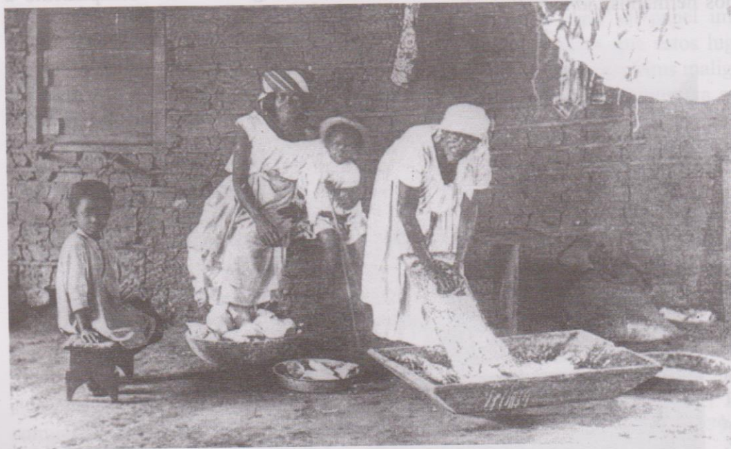
Mujeres Garífuna en el interior de una vivienda, rayando Yuca para la elaboración del Cazabe.