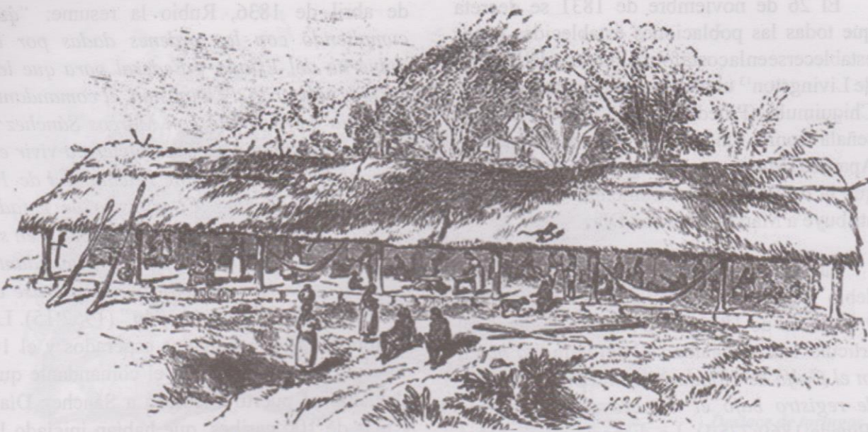
Vivienda de negros caribes en Laguna de Perlas, Nicaragua. E.G. Squier, 1891. Tomado de: Historia General de Guatemala . Asociación de Amigos del País. Fundación para la Cultura y el Desarrollo.