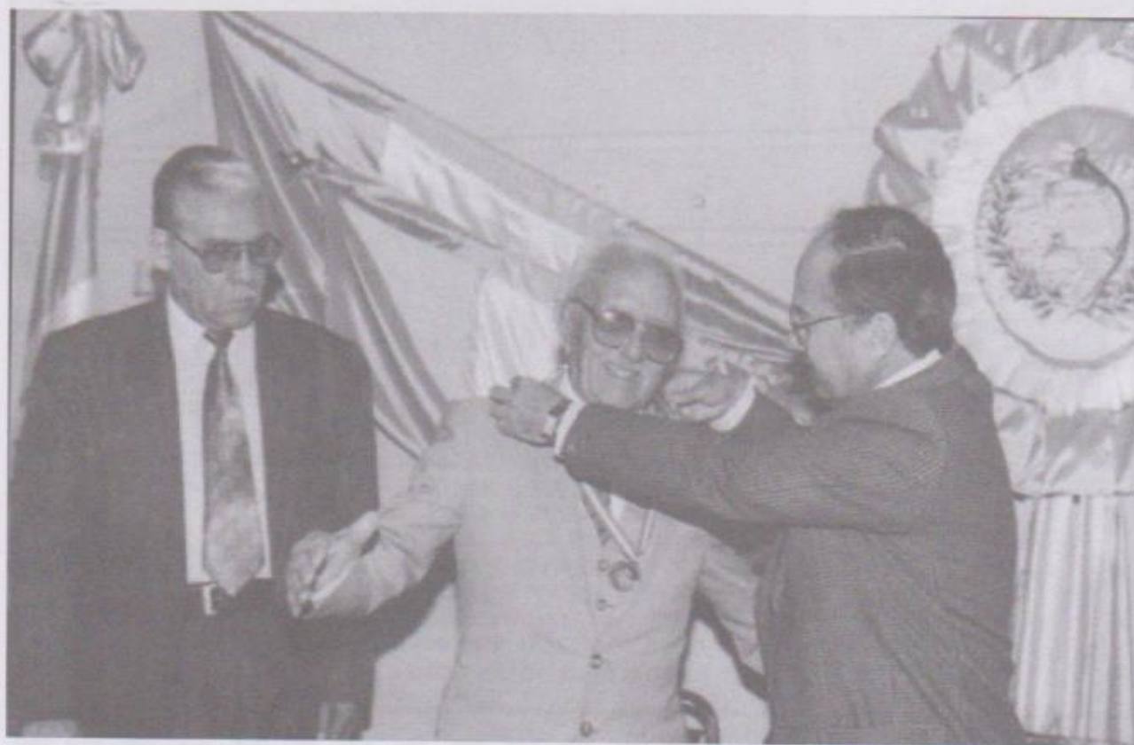
Recibiendo la medalla impuesta por el entonces Procurador de los Derechos Humanos Jorge Mario García de la Guardia.