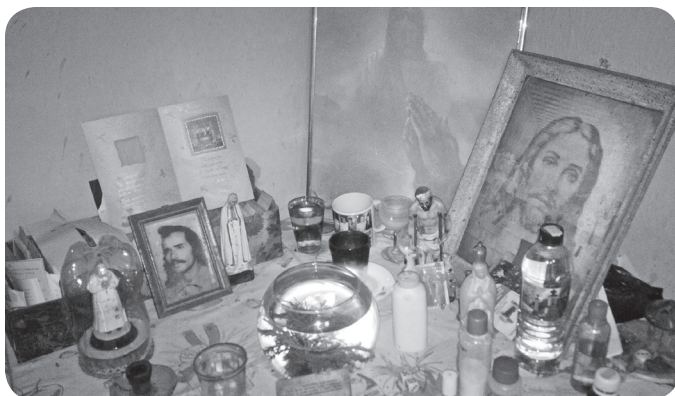
Altar de Francisco Rizo.