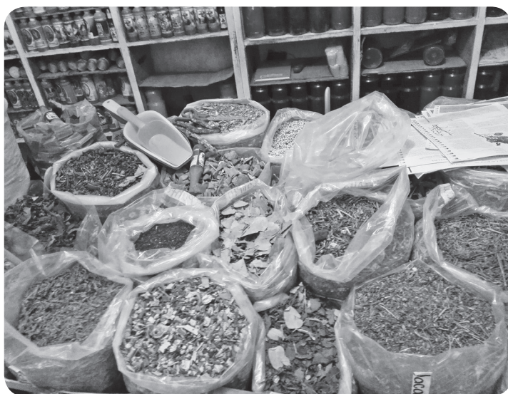
Componentes para las terapias.