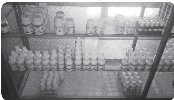
Productos a la venta en el consultorio de Margarito Córdova.