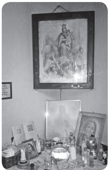
Altar de Francisco Rizo.