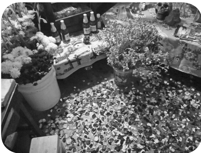
Flores, símbolo de equilibrio.