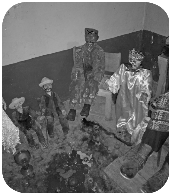
San Pascual, San Simón, el Ajitz, El Duende.

Se concluye que dentro de las dinámicas ceremoniales, la utilización de elementos naturales como los mencionados son parte de la fase de curación y explicación de los fenómenos que aquejan la salud de las personas que acuden a estas prácticas populares. Esto conlleva a un alivio por medio de la medicina espiritual y natural, que es la medicina tradicional de la comunidad de Samayac.