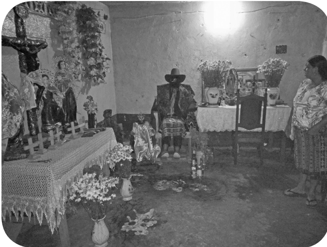
Altar a San Simón y San Pascualito con imágenes religiosas.

Lo que yo utilizo para ceremonias es el copal...candelas y el incienso con la mirra...las velas que tienen sus significados... la verde es para el dinero... blanco es para la protección y curación... la roja también para la protección y curación... y el amarillo que es la sanidad de las personas.