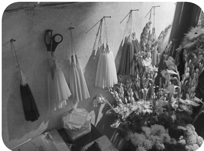
Veladoras y su significado (trabajo, bienestar, protección, salud, sanidad)