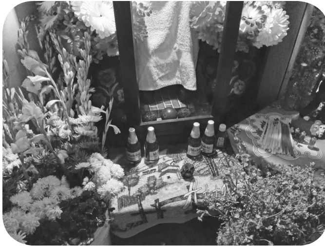
Cerveza para agradecer.