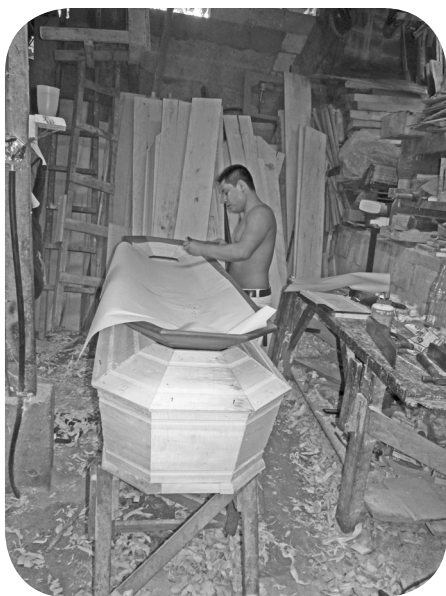
Operario coloca papel de envolver a la tapadera de la caja.