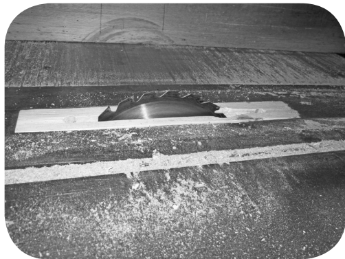
Sierra eléctrica para cortar madera.