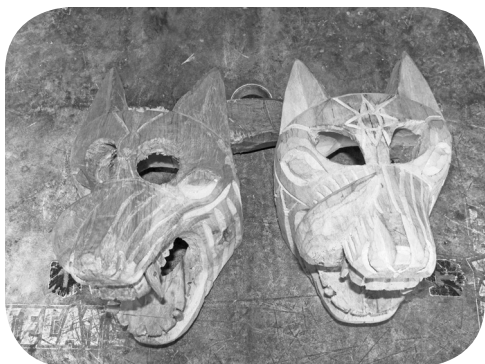
Máscara de perros, autor: Bernardino Pérez Hernández.