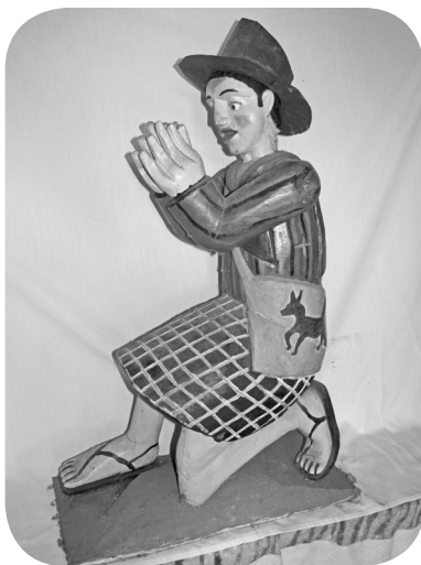
Escultura de personaje sololateco, autor: José Manuel Solval.