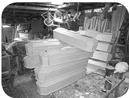
Cajas para difunto sin pintar.