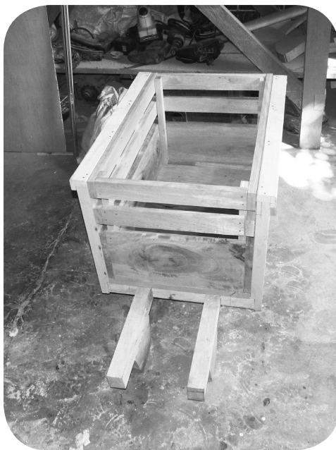
Carrocería de camioncito de juguete.