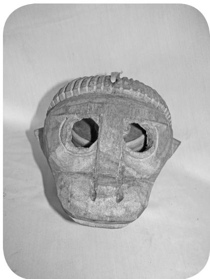
Máscara de mono, autor: Bernardino Pérez Hernández.