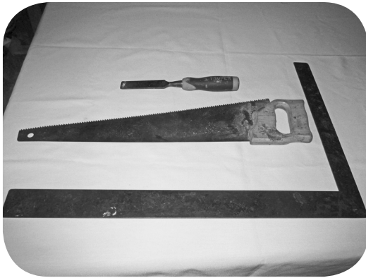
Escuadra, serrucho y formón.