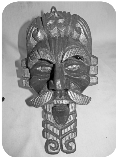
Máscara de moros, autor: Bernardino Pérez Hernández.