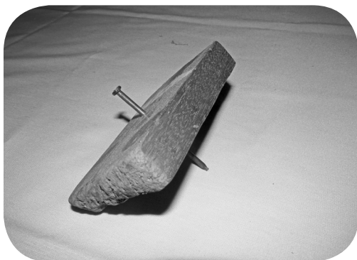
Gramil, para centrar las puertas de las ventanas.