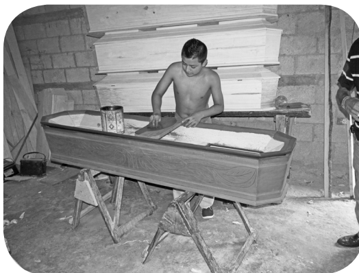
Operario sella una caja mortuoria.