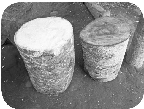
Trozos de maderas de chonte y canoj.