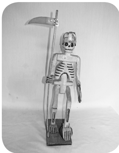
La Santa Muerte, autor: José Manuel Solval.