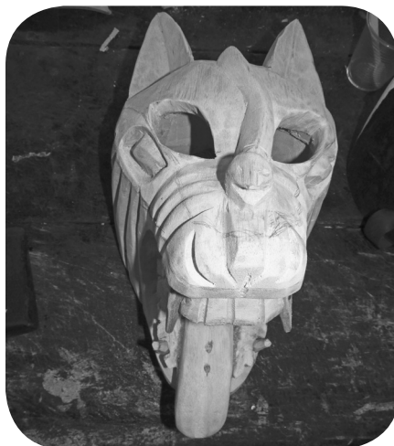
Máscara de perro con lengua de fuera, autor: Bernardino Pérez Hernández.