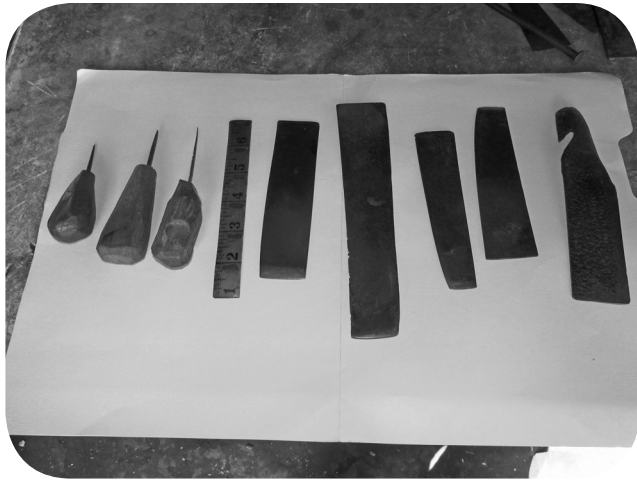
Herramientas para hacer las máscaras.