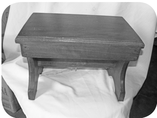
Mesa de centro, autor César Cifuentes Solís.