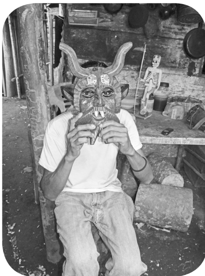
Mascarero cubre su rostro con la máscara de diablo.