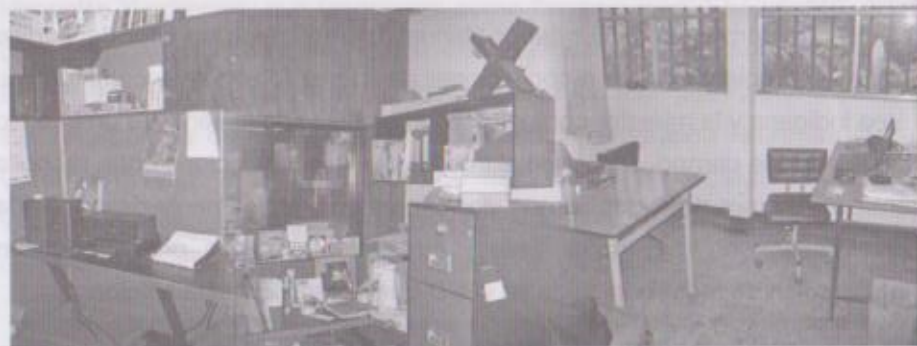
Diferentes perspectivas de la isla de edición (a) y de la oficina (b y c) del Área de Etnomusicología. CEFOL, 2007.

Stöckli centró sus primeras recopilaciones de campo en Guatemala entre los k'iches de Totonicapán, los Achí de Rabinal y los q'eqchi' de la Alta Verapaz. Ingresaron al archivo copias de su trabajo cuando realizaba sus estudios doctorales. Además realizaron algunas visitas de campo con Arrivillaga durante ese periodo y que se renuevan luego en los departamentos de Huehuetenango, San Marcos, Alta y Baja Verapaz y Guatemala.