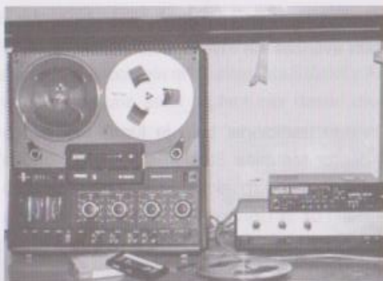
Equipos de sonido del Área de Etnomusicología en la década de 1980.