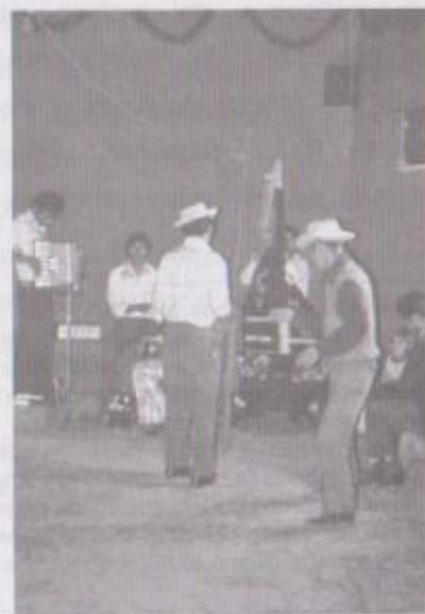
Conjunto "Los Madrugadores" (arpa, acordeón, batería, violines). San Juan Sacatepéquez, 2 de mayo de 1978.

Desarrolla estudios específicos que dan como resultado: El Baile de las Flores (1976), Aportes para el estudio de la etnomusicología guatemalteca (1977, una reflexión -teórica- sobre la disciplina en Guatemala); Una experiencia etnomusicológica (1978, sobre las marimbas de Chuarrancho); La música en los rituales dedicados al maíz (1979, incluye un disco de 45 rpm). Es muy probable que Juárez Toledo se encontrara en una reformulación de sus conceptos sobre el fenómeno sonoro de Guatemala, algo que debió sacudir las posiciones con un fuerte tamiz nacionalista que sostenía.