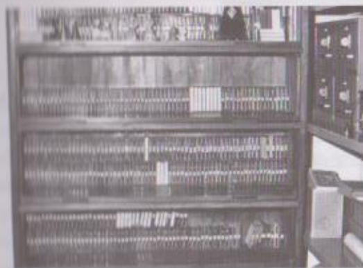
En este mueble se ubicaba antes el acervo de grabaciones de terreno.