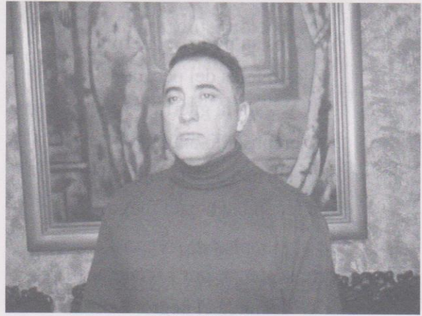
Escritor: Milton Torres

Jurídicas y Sociales de la Universidad de San Carlos en los cursos: Lengua y Literatura, Introducción a la Sociología y Filosofía, en la actualidad labora como catedrático de la Facultad de Humanidades de la Universidad Rafael Landívar.