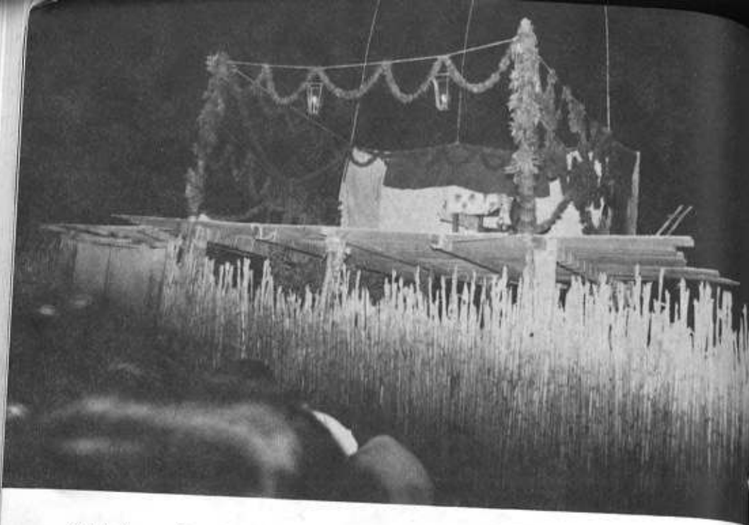
Tablado para loa. Sumpango, Sacatepéquez.

"m'hijo pagó cinco quetzales sólo por copiarlas." (A). 15