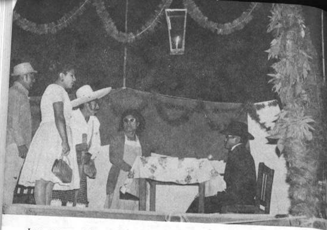
Loa representada en Ciudad Vieja, Sacatepéquez.

En 1621 la Orden franciscana declara a la Inmaculada Concepción patrona principal de la Orden. En 1760 es declarada patrona de España y sus Indias. El pueblo crecía en entusiasmo ante el misterio enriqueciendo la celebración con su concurso. 5 Finalmente, frente a abrumadoras peticiones, Pío IX el 8 de diciembre de 1854 declaró dogma de fe la hasta entonces "piadosa creencia".