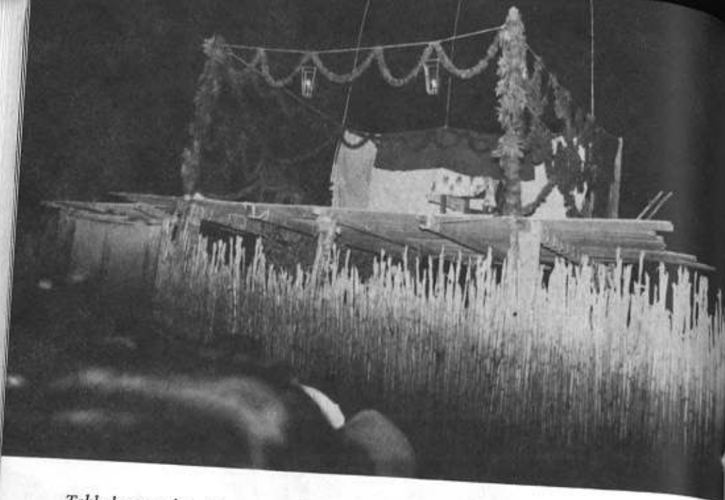
Tablado para loa. Sumpango, Sacatepéquez.

"m'hijo pagó cinco quetzales sólo por copiarlas." (A). 15