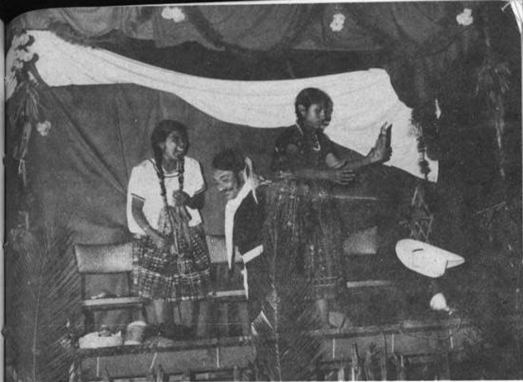
Loa de indios. Ciudad Vieja, Sacatepéquez.

Tal cosa la argumentaba basado en el franciscano Guillermo de Ware que enseñó antes de 1300 la Inmaculada Concepción sobre su célebre principio: potuit, deuit, fecit . 4