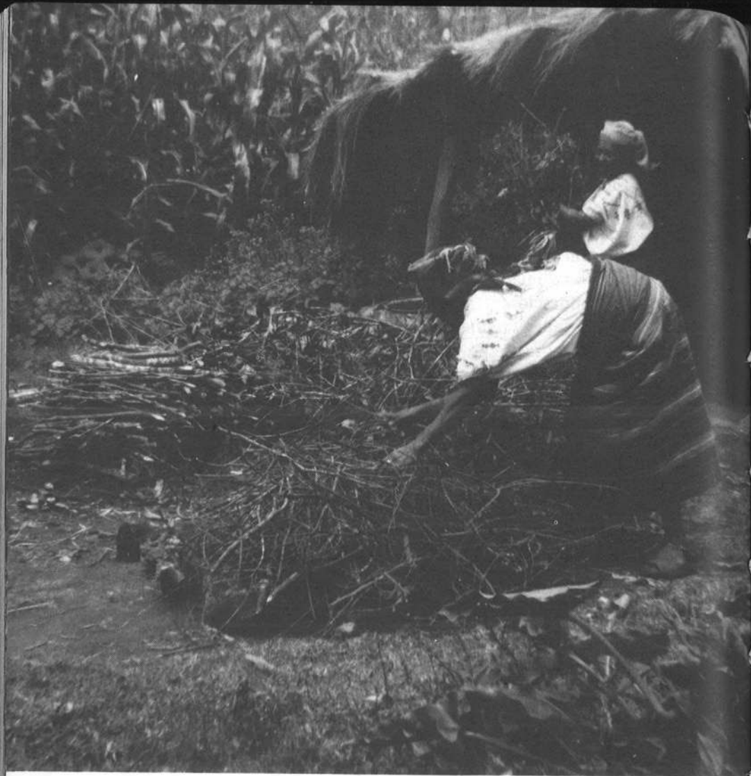
En seguida se cubren con chiribiscos y pino seco (pajón)...

y a la importancia que la misma tiene como fuente de ingresos para la economía hogareña.