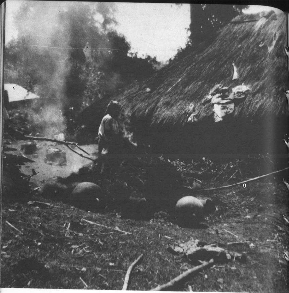
Las mujeres atizan constantemente el fuego.

importante para el mantenimiento de la familia, aunque, como dijimos anteriormente, la remuneración que obtienen por sus productos, no corresponde al valor de este trabajo. Esto se puede comprobar al hablar con las alfareras quienes nos indicaron los precios, los cuales son los siguientes: un incensario pequeño, quince centavos; las alcancías pequeñas, cinco centavos; los floreros, cincuenta centavos, y así sucesivamente. Es por eso que pensamos que se hace sentir la falta de una legislación adecuada que permita la dignificación del artesano guatemalteco, para que así tenga esta cerámica una mejor proyección y demanda, como la de Chinautla, Jalapa, etc., y para que no se transformen sus figuras tradicionales.