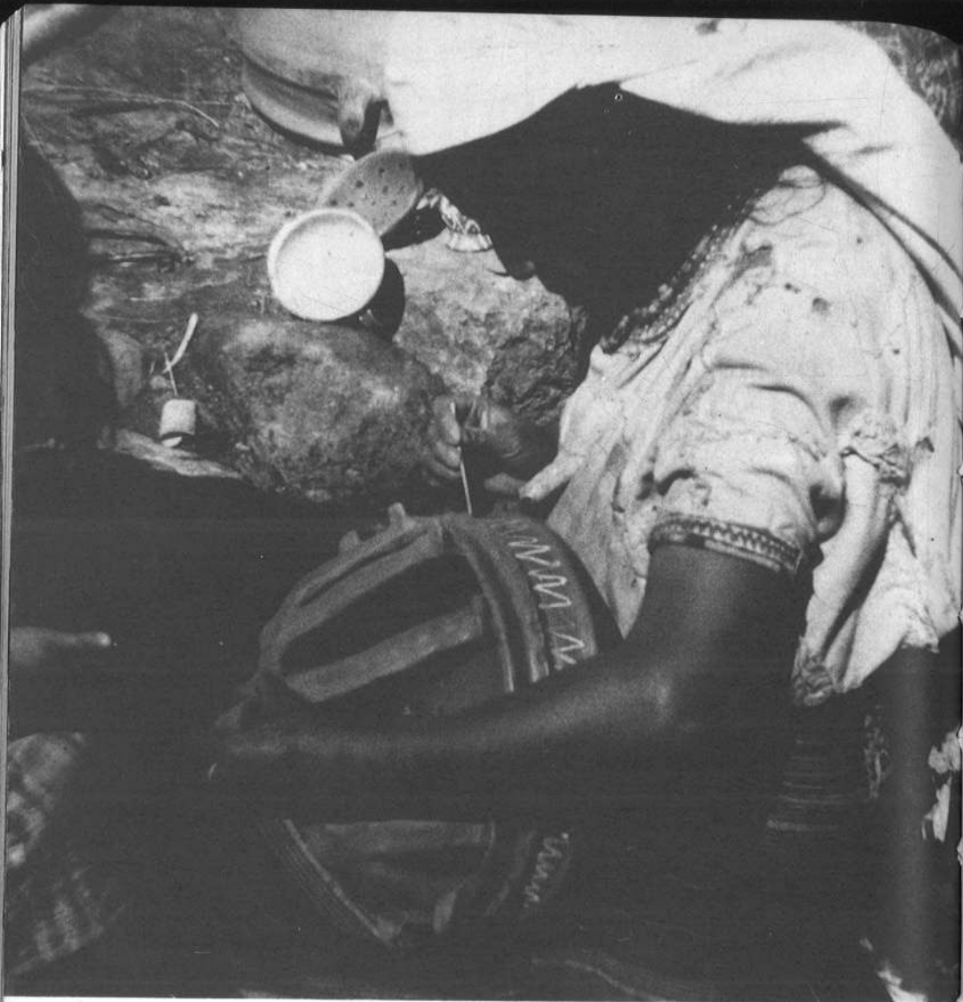
Ya secas se les echa cocó o pintura roja, y en algunos casos pintura blanca.