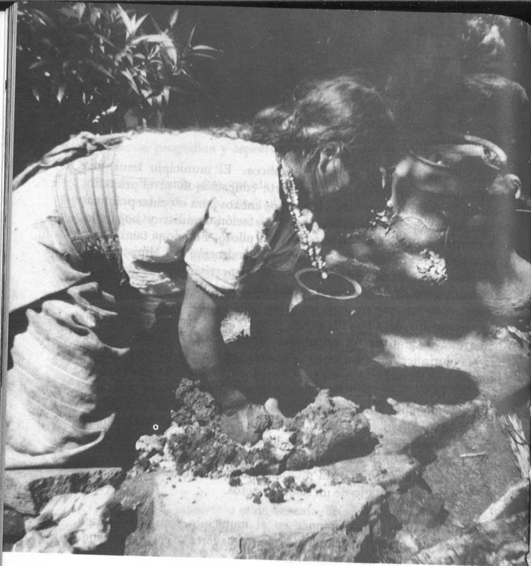
El barro se muele con piedra de moler. . .

debido a que su conocimiento del castellano, como ya se señaló anteriormente, es limitado, salvo contadas excepciones.