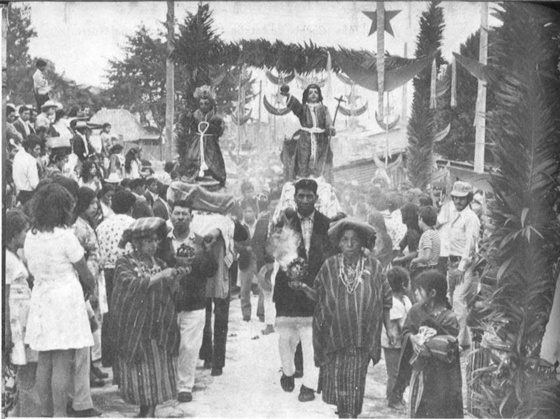
Procesión indígena. Corpus de Patzún. (Fotografía: Manuel Guerra).