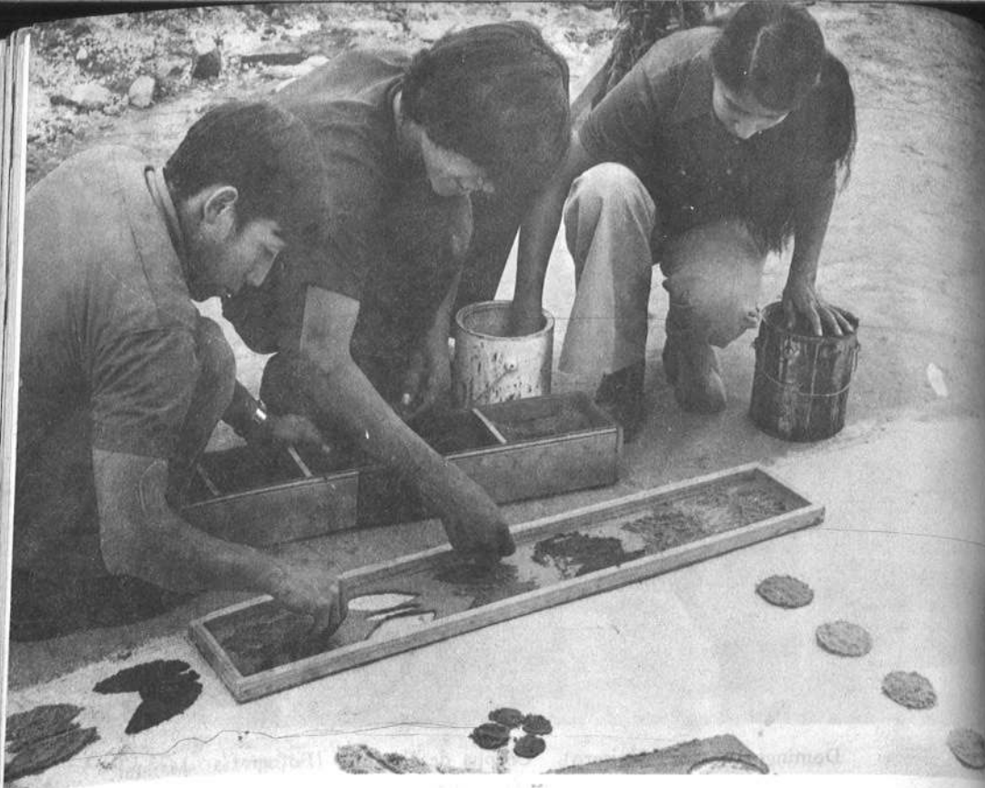
Confeccionando una alfombra para el Corpus de Patzún.