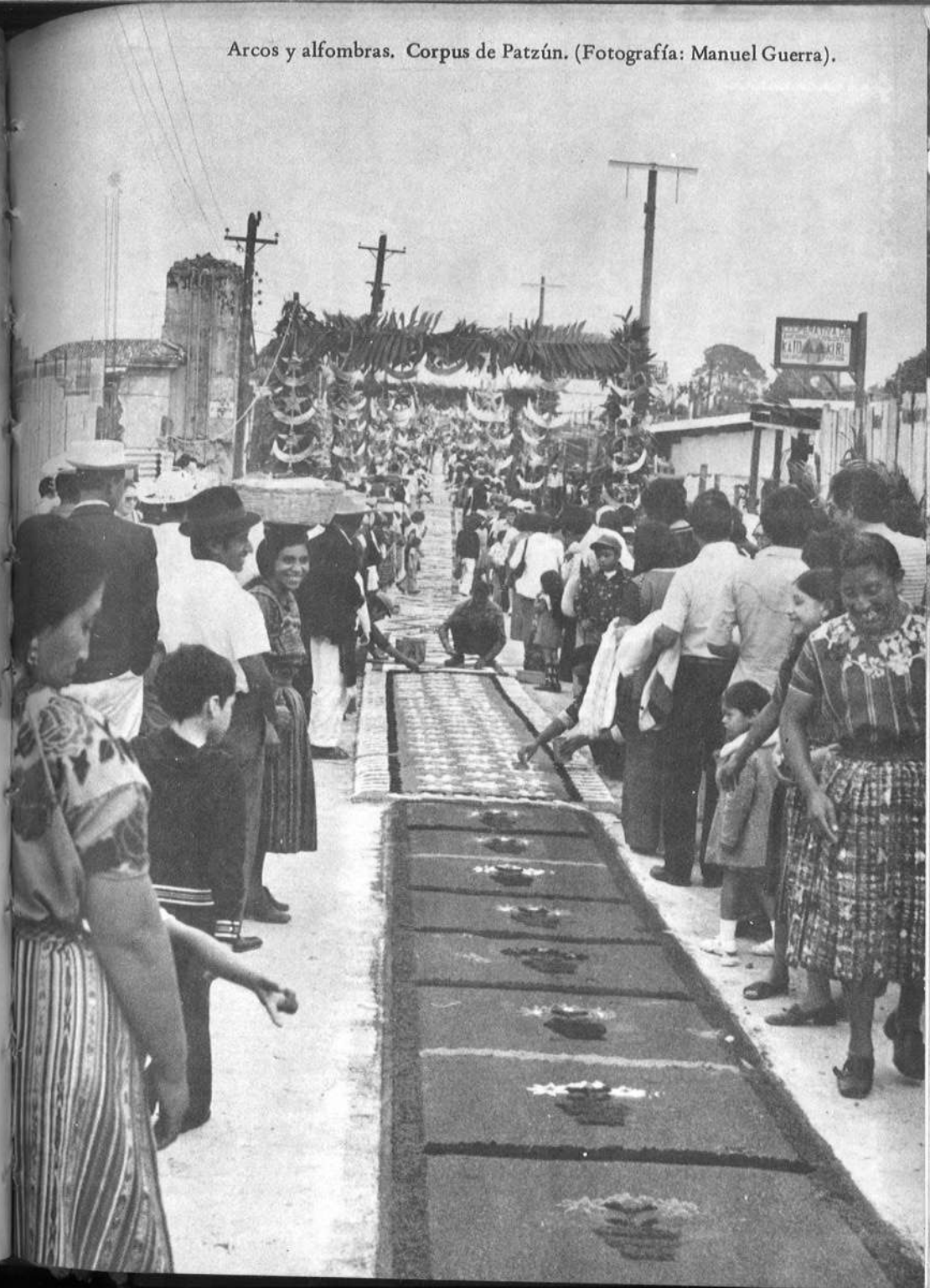
Arcos y alfombras. Corpus de Patzún.