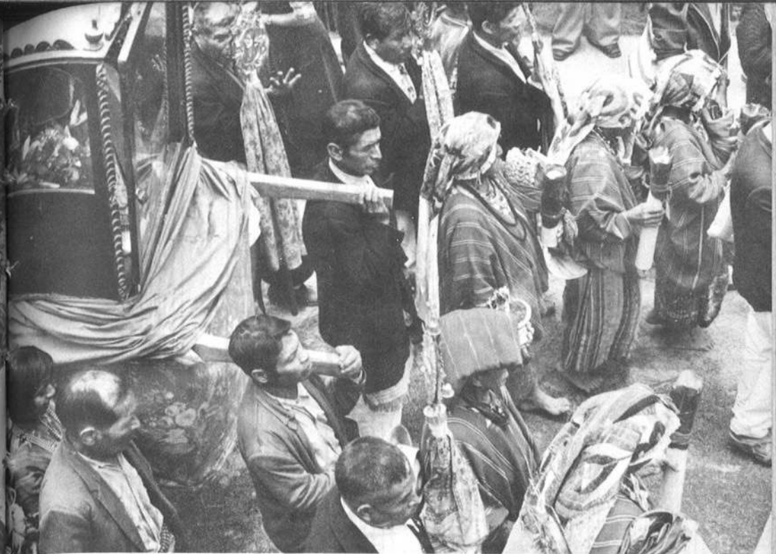
Cofrades (capitanas y principales) en la procesión indígena del Corpus de Patzún.