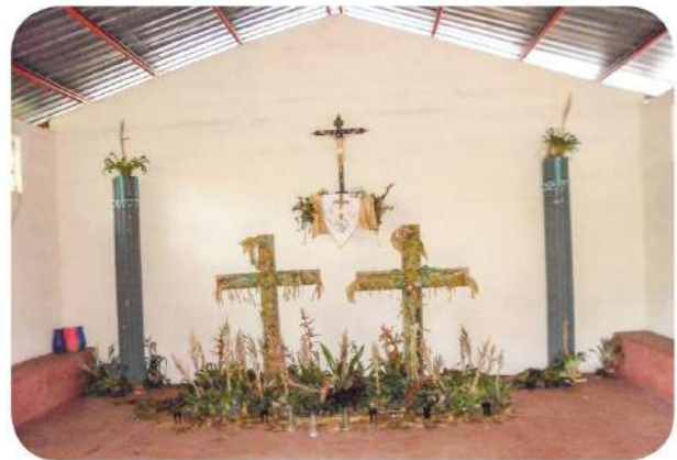
Figura 5 Interior del templo agrario en el que se encuentran tres cruces.