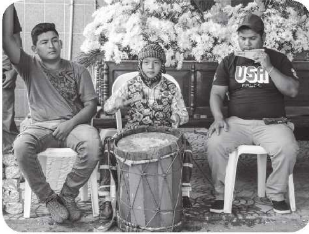
Figura 10 Jóvenes ejecutando la música tradicional con pito y tambor