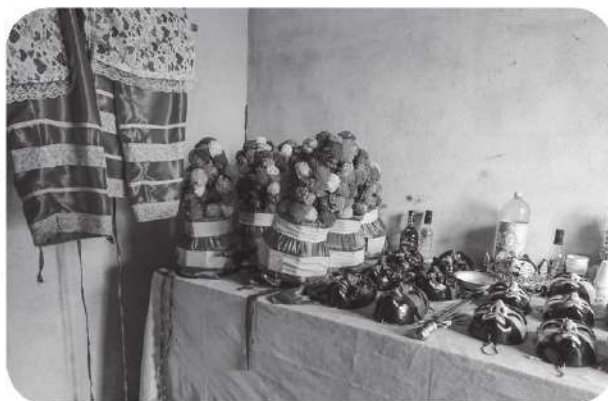
Figura 14 Mascaras colocadas en una mesa para llevar a cabo el ritual de velación de las mismas