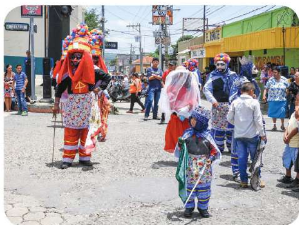
Figura 9 Danza de moros y cristianos en las calles de Chiquimula (año 2017).