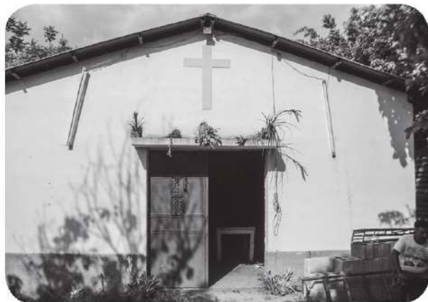
Figura 13 Templo agrario ubicado frente al cementerio de Chiquimula