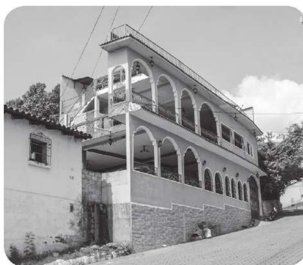
Figura 2 Casa en la que se encuentra la cofradía El Niño Rey Justicia Mayor (barrio San Pedrito).