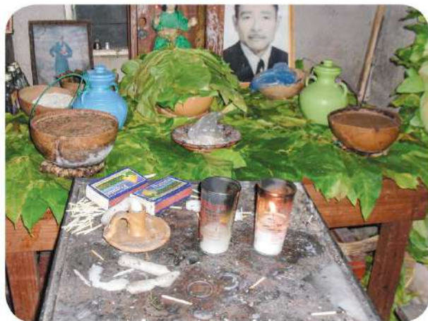
Figura 7 Altar del Niño Rey