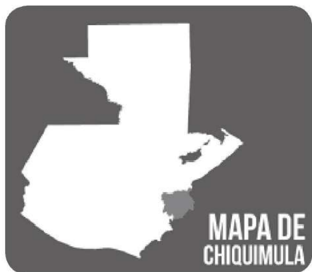
Figura 1 Ubicación de Chiquimula en el mapa de Guatemala