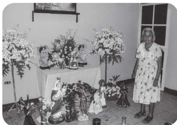
Figura 3 Altar de la cofradía abierto a los visitantes.