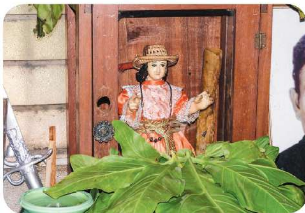
Figura 6 Imagen del Niño Rey Justicia Mayor en su escaparate