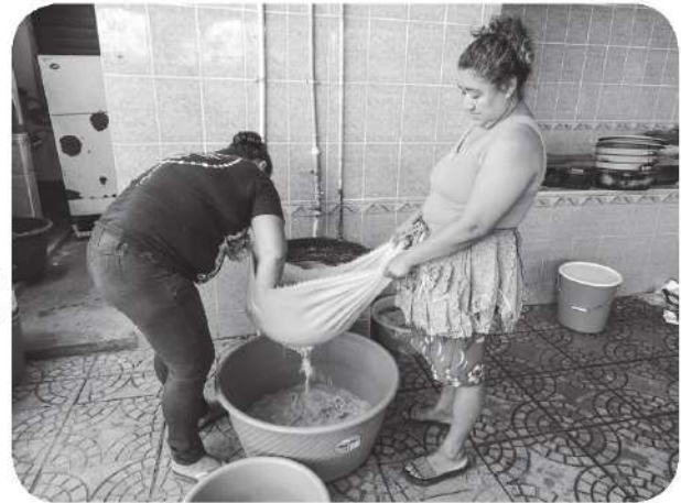
Figura 11 Mujeres trabajando en la elaboración de chilate