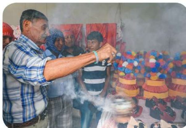
Figura 8 Padrino llevando a cabo el ritual de levantado de máscaras