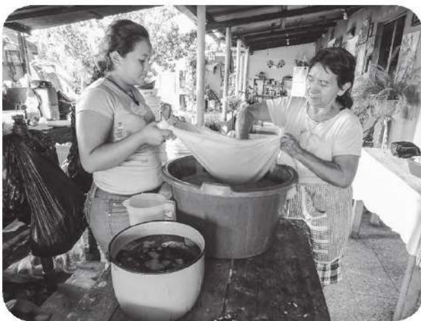
Figura 12 Mujeres elaborando el chilate (bebida ceremonial)