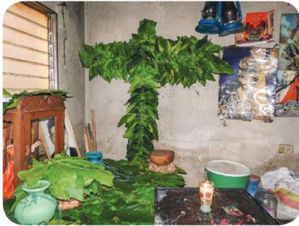
Figura 4 Altar de la imagen del Niño Rey, es el principal y no está abierto a los visitantes.