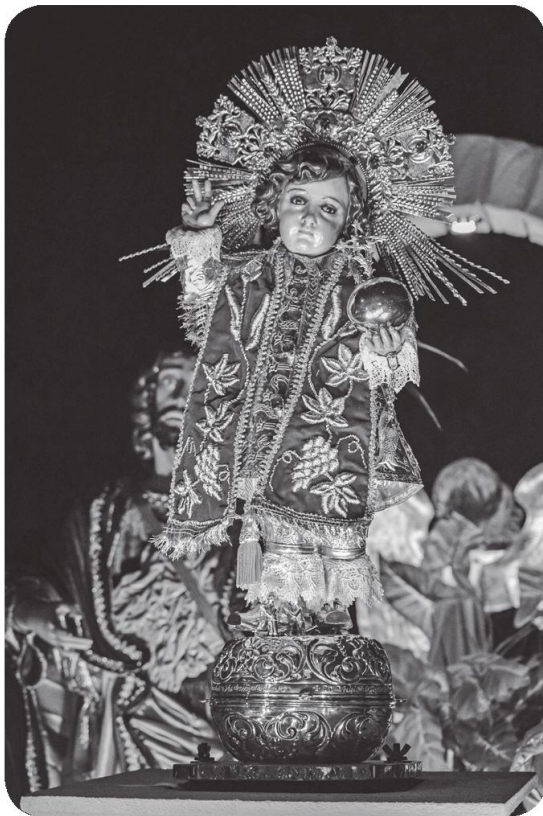
Figura 4 Niño del Santísimo de la ciudad de Quetzaltenango