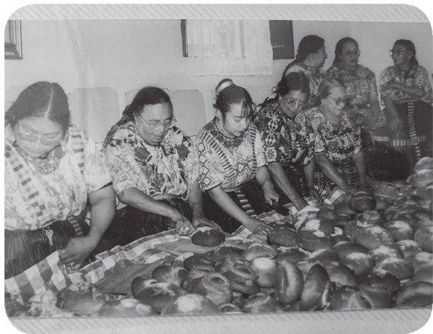
Figura 7 El pan, alimento importante en las celebraciones de la Cofradía