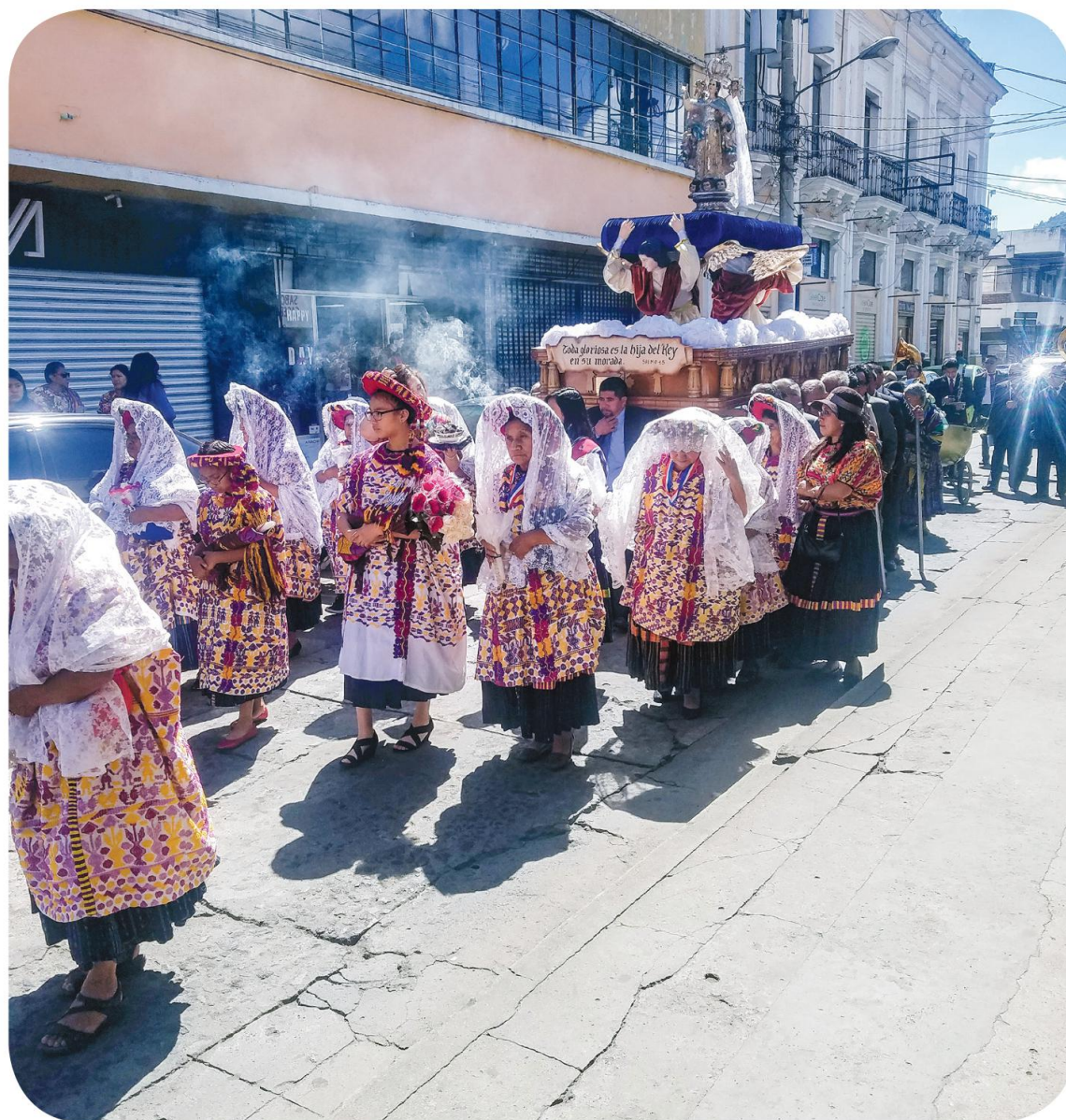
Figura 12 Procesión de la Virgen de los Ángeles, organizada especialmente por mujeres