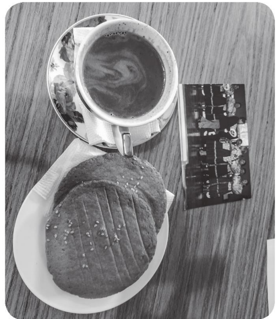
Figura 14 Gastronomía y tradición presentes en los hogares quetzaltecos