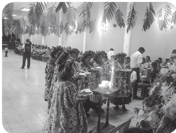
Figura 8 La mujer quetzalteca columna principal para mantener las tradiciones y construmbres