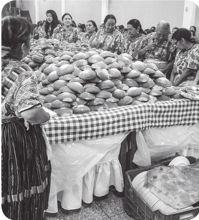
Figura 10 El trabajo de las mujeres servido en la mesa