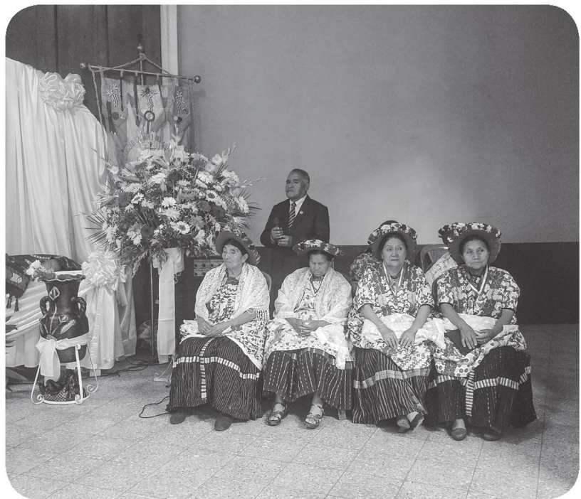
Figura 11 Las mujeres siempre presentes en la organización de las fiestas de la cofradía