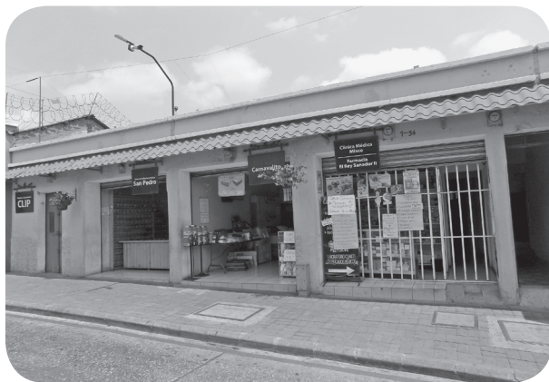
Figura 14 Casa Balcárcel, tradicional con parapeto. (Chajón).