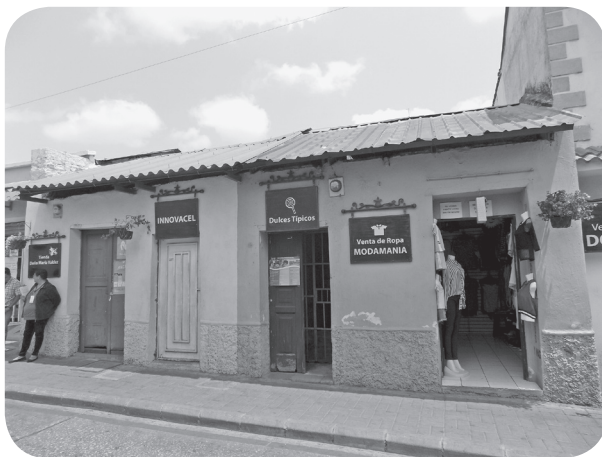
Figura 13 Casa Valdez, tradicional con alero. (Chajón).