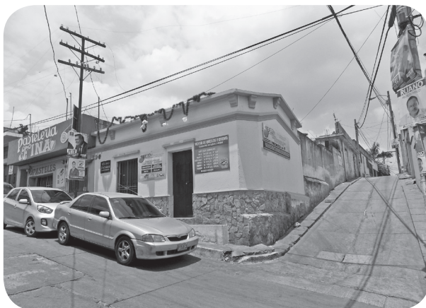
Figura 17 Casa Borrayo, historicista con ménsulas. (Chajón).