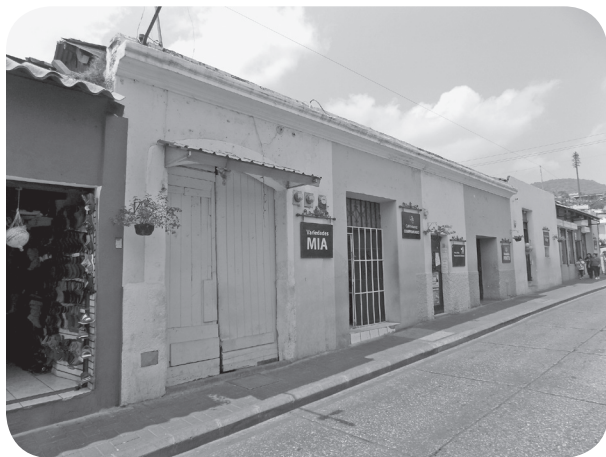
Figura 12 Casa Hurtarte, tradicional con parapeto. (Chajón).