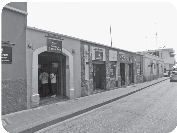
Figura 8 Casa Gómez, tradicional con alteraciones. (Chajón).