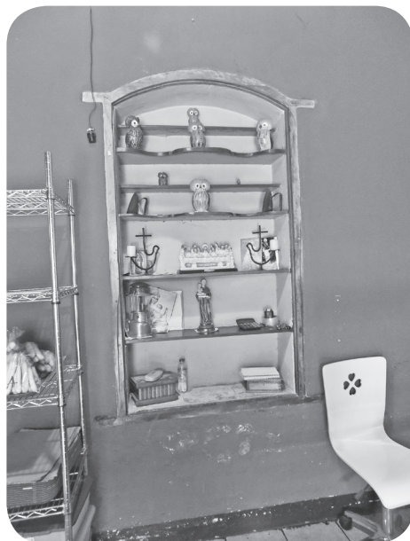
Figura 15 Casa Rivera O'Meany, alacena empotrada. (Chajón).