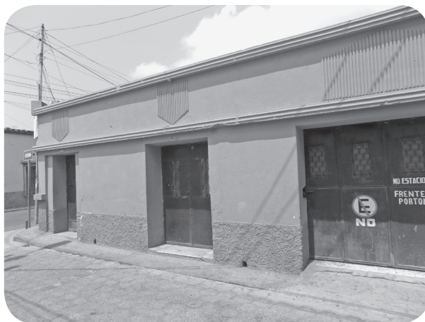
Figura 11 Casa Santos Borrayo (2), tradicional con parapeto Art Decó. (Chajón).