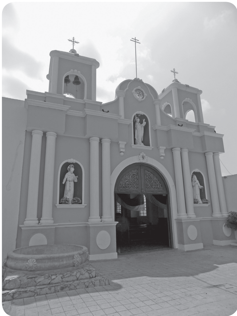
Figura 27 Oratorio de Santo Domingo. (Chajón).