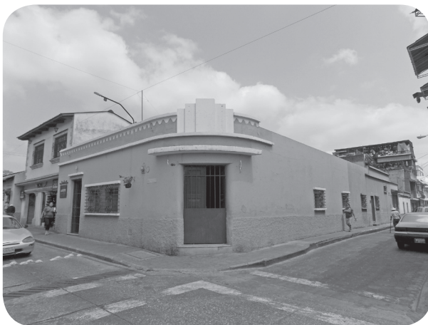
Figura 9 Casa Santos Borraro, Art Decó. (Chajón).