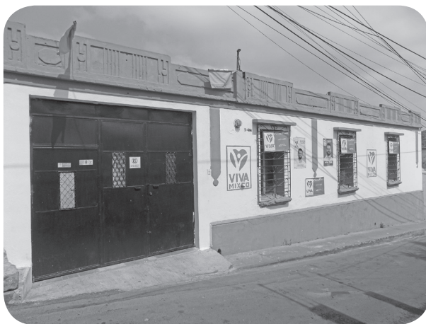
Figura 5 Casa Rodríguez, historicista con elementos Art Decó. (Chajón).