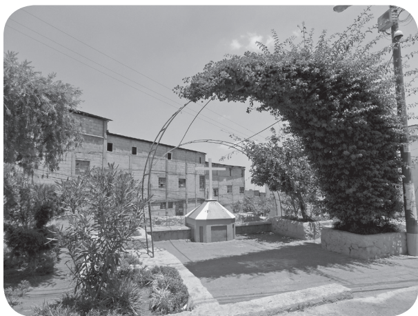
Figura 4 Cruz del Calvario. (Chajón).