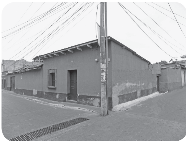
Figura 21 Casa González Obregón, tradicional alterada. (Chajón).