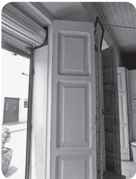
Figura 16 Casa Rivera (3), puerta tradicional. (Chajón).