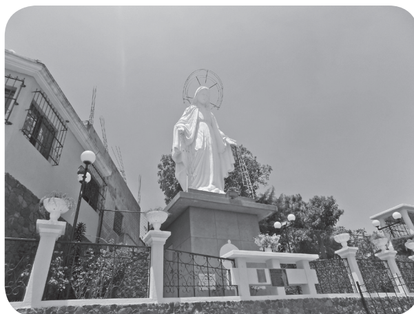
Figura 3 El Cerrito, La Plaza de la Paz, recurso decorativo. (Chajón).