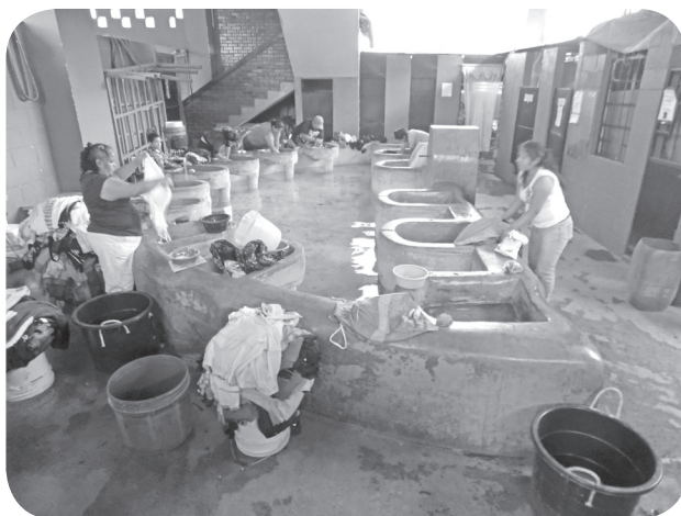
Figura 25 Pila. (Chajón).