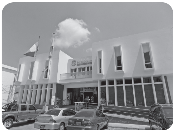
Figura 2 Municipalidad, Edificio Anexo, funcionalismo. (Chajón).