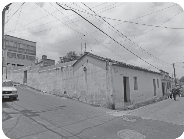
Figura 20 Casa Tablas, tradicional. (Chajón).