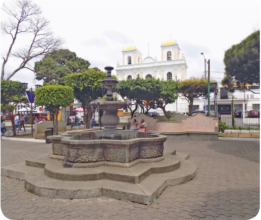
Figura 23 Parque. (Chajón).