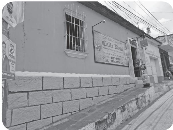
Figura 18 Casa Santos, tradicional con alero y sillares. (Chajón).