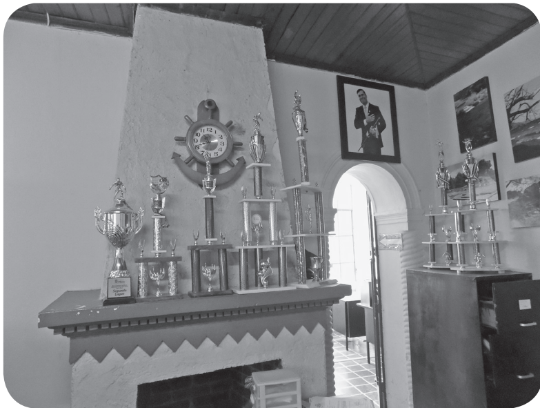
Figura 1 Casa Ogarrio, historicista. (Chajón).

Herrera, C. (24 de agosto de 2019). Entrevista. Entrevistador: Aníbal Chajón.