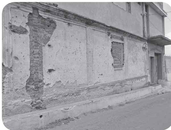
Figura 19 Casa Colaj, historicista en deterioro. (Chajón).