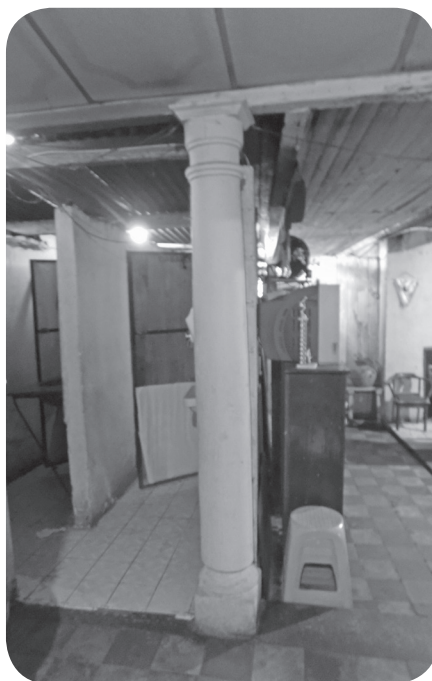
Figura 7 Casa Rivera, elemento tradicional: pie derecho. (Chajón).