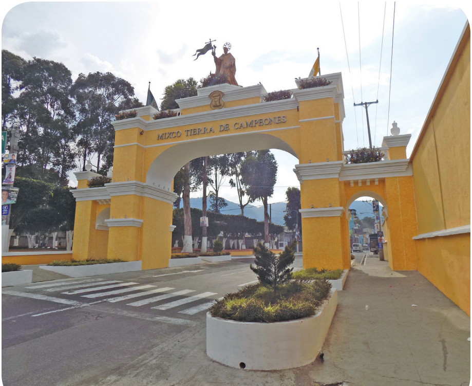
Figura 26 Arco de Santo Domingo. (Chajón).