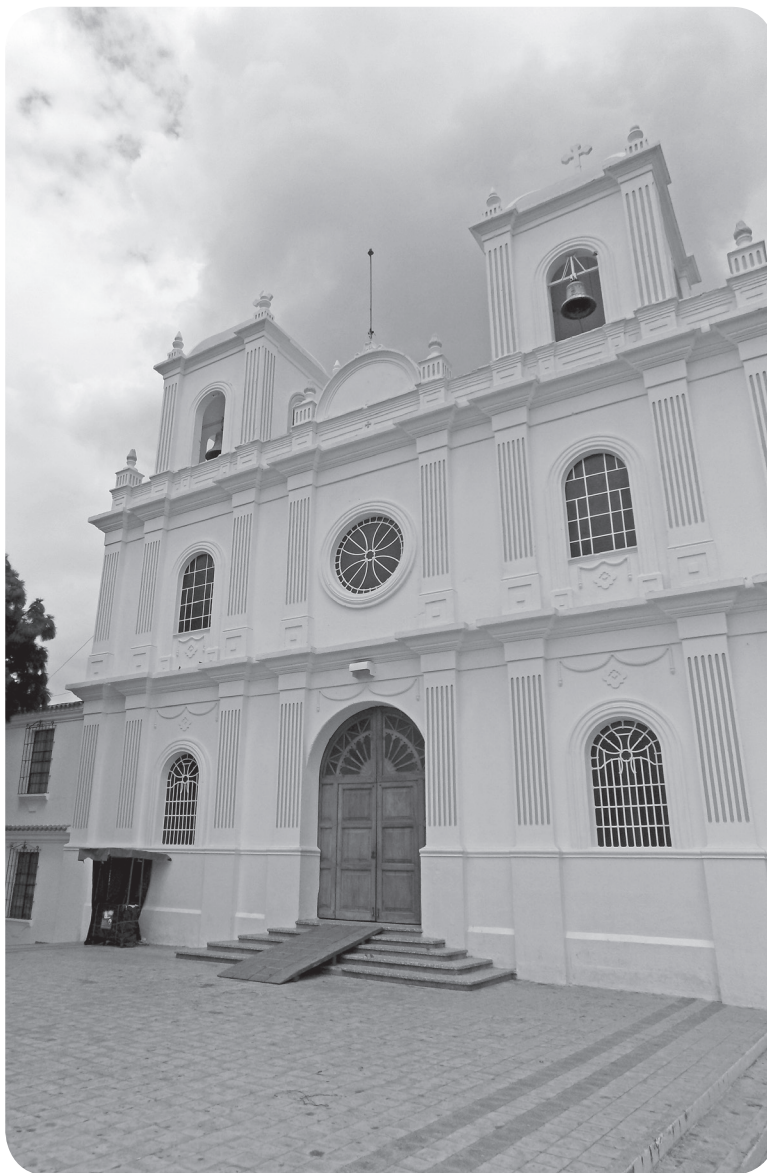
Figura 22 Templo católico. (Chajón).