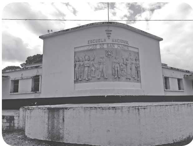
Figura 24 Escuela Tipo Federación. (Chajón).