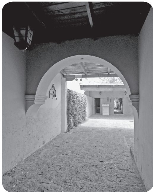
Figura 10 Casa Arjona, zaguán tradicional. (Chajón).