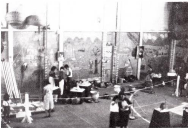
Aspectos de la Exposición-Venta.