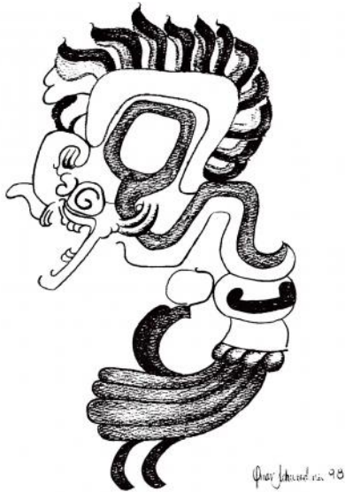
Representación de efígie serpiente emplumada, símbolo sagrado desde tiempos prehispánicos. Se encontraba en un vaso policromo localizado en Altun Ha. El rey Kam ek (kam = serpiente, ek = estrella o inframundo) utilizó esta denominación como símbolo y nombre.

A partir de 1870 estalló en Yucatán una gran insurrección indígena conocida como "guerra de castas" lo que hizo del territorio petenero un refugio de muchos de estos mayas sublevados, los que sin duda se mezclaron con los Itza' y Mopanes contribuyendo a la conformación cultural de éstos grupos. Por otro lado, fueron los motores de constantes rebeliones indígenas en territorio petenero. A pesar de que las autoridades españolas habían logrado reducir a los Itza' en San José Petén, a los Mopanes en San Luis Petén, debido a malos tratos, fueron emigrando a otras tierras. En 1876 muchos itza' emigraron inicialmente a Tikal y Yaxha y finalmente a San José Soccotz en territorio Beliceño. Estos movimientos poblacionales continuaron a lo largo de este siglo y llegaron a su máxima expresión durante la dictadura de Estrada Cabrera. En ese entonces, bajo el mando de Jefe Político Federico Ponce Vides, se dispuso que los Itza' deberían abandonar su idioma por el español. Quienes no acataban esta orden, fueron sometidos a denigrantes castigos.