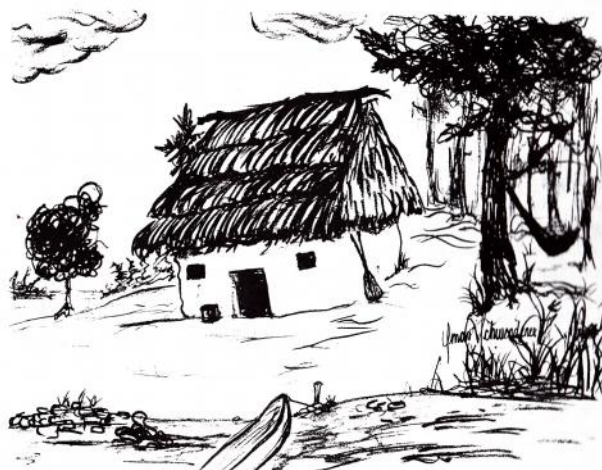
Vista ideal de una casa Itza'. En ella se aprecia el "canche" (banco de madera) y los canaletes que siempre son dejados cerca de la casa. Además podemos ver una hamaca y la canoa, vital en sus actividades cotidianas.

regularmente ubicadas en una separación del cuarto por una pequeña pared o un biombo. Además, en una pequeña mesa se encuentra instalado el altar doméstico, con imágenes de santos de su devoción, candelas y agua, entre otros. Continuo a la casa de habitación, se tiene un cuarto más pequeño donde está la cocina. Esta consiste en un pequeño fogón elevado sobre una plataforma de barro. Aquí se guardan también la leña y los utensilios usados en la preparación de los alimentos. Los Itza', suelen tener además una pequeña casa continúa a sus milpas, en donde habitan en las temporadas más intensas del trabajo y almacenan los granos de la cosecha. En los años recientes los bajos rendimientos de los suelos y la escasez de tierra han hecho de esta una actividad poco frecuente para los Itza'.