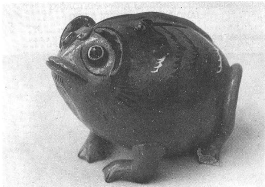
Alcancia de Cerámica pintada (Antigua Guatemala)

Los juguetes populares se encuentran vigentes dentro de las clases populares, a pesar de la imposición de los juguetes de plástico producidos en serie a que tales clases se ven sometidas. Imposición que se hace especialmente a través de los medios de comunicación.