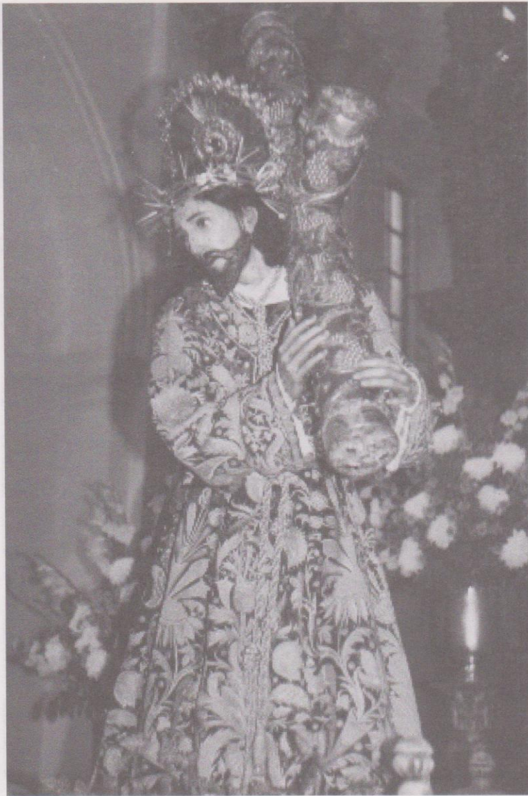
Ilustraciones 1 y 1 A.

Pintura y fotografía de Jesús Nazareno de la Merced de la Nueva Guatemala. Escultura que podría marcar el nacimiento de una escuela escultórica local que materializa los primeros aportes al arte hacia la segunda mitad del siglo XVII.