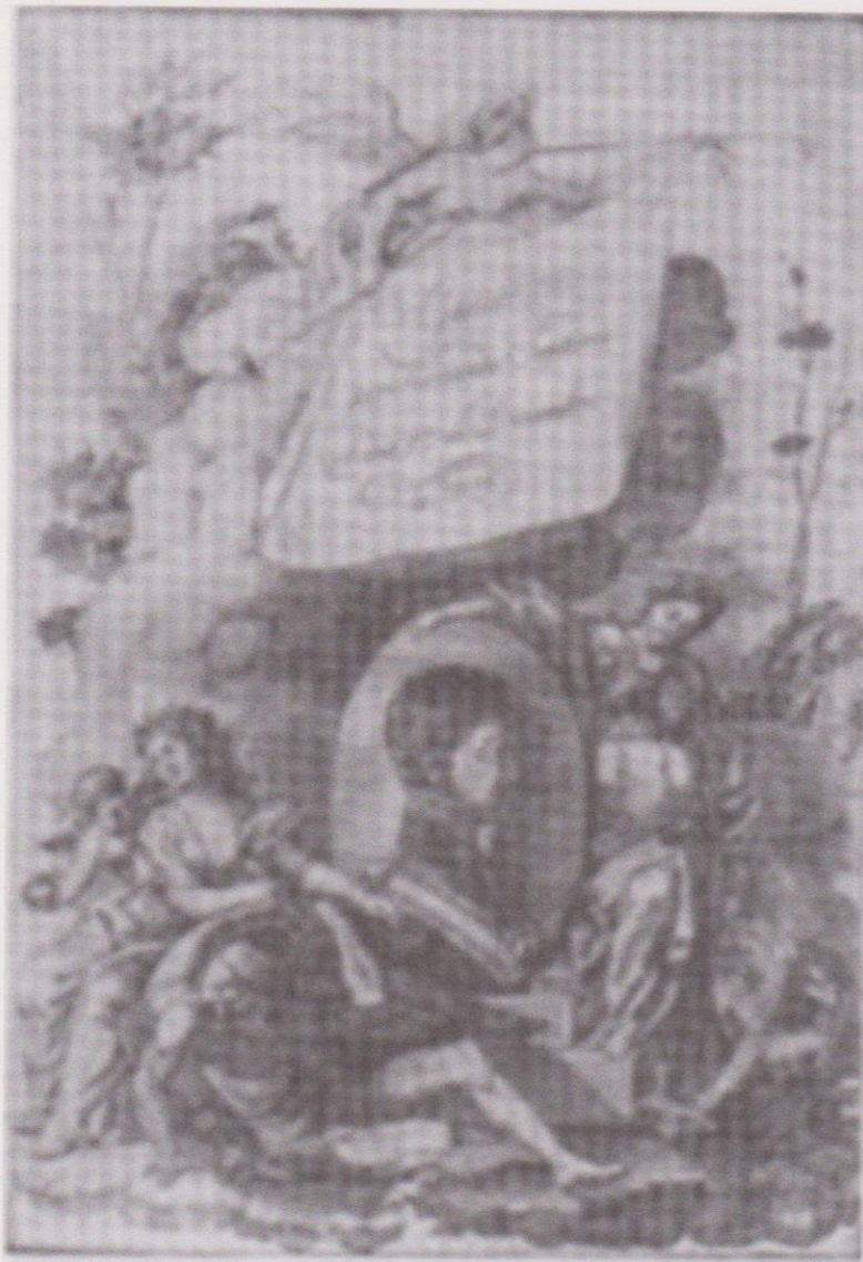
Grabado del libro de la Jura de Fernando VII, en 1808 en Guatemala. Grabado de Cecilia España.