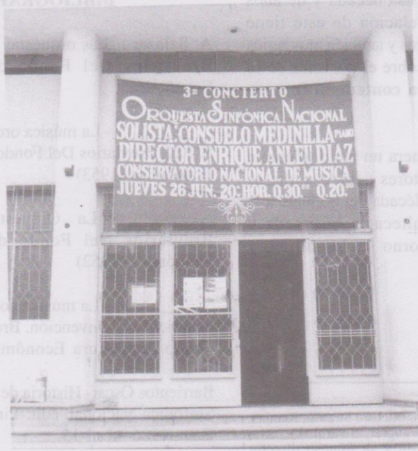
Anuncio en el conservatorio Noe en un concierto de la O.S.N.