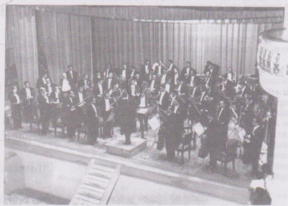
la O.S.N. actuando en la República de El Salvador