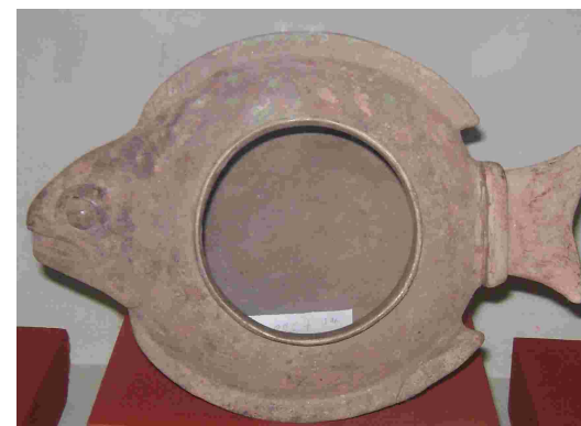
Fotografía 4. Cuenco cuyo cuerpo está representado por la figura de un pez. Fue encontrado en Kaminaljuyú y está fechado para el Clásico Temprano. Museo Nacional de Etnología y Arqueología de Guatemala.

Vuh, 1970: p. 94). Por los hábitos nocturnos del pez, podría denotarse un simbolismo asociado a los seres que habitaban el Inframundo maya o Mundo de la Noche y de la Muerte. Otra de las figuras es la tortuga, cuyo simbolismo dentro de la cultura maya era de gran trascendencia. Según la tradición maya, el mundo estaba sostenido por una tortuga. Uno de los cuatro Bacabs(3), colocados en los cuatro puntos cardinales para sostener los cielos, estaba representado por un caparazón de tortuga.