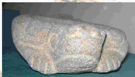
Fotografía 7. Vista frontal de piedra de moler bicéfala, nótense el rostro y las ancas. Museo Nacional de Etnología y Arqueología de Guatemala.