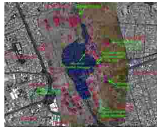
Fotografía 3. Reconstrucción hipotética del Lago Miraflores y Kaminaljuyú con los canales de riego situados en el este.