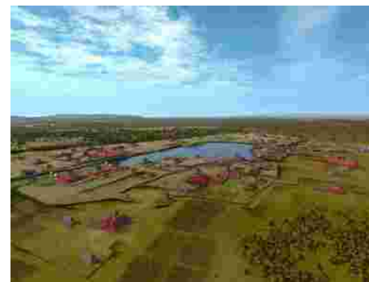
Fotografía 1. Reconstrucción digital de Kaminaljuyú con el Lago Miraflores.

Desde sus inicios, la mayoría de ciudades mayas fueron desarrollándose alrededor de cuerpos de agua. Uno de los más claros ejemplos, Kaminaljuyú –considerado el sitio maya más importante del Altiplano Central de Guatemala y asentado a orillas del extinto Lago Miraflores (fotografía 1)–, desarrolló un complejo sistema de canales de riego que le permitió el manejo de tecnologías hidráulicas para la irrigación de amplias zonas de cultivo, desde el Preclásico Medio (800 A.C - 250 A.C.). Con base en estudios arqueológicos realizados en el área