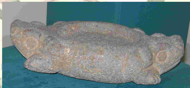
Fotografía 6. Piedra de moler bicéfala proveniente de Kaminaljuyú, representando dos sapos y fechada para el preclásico tardío. Museo Nacional de Etnología y Arqueología de Guatemala.