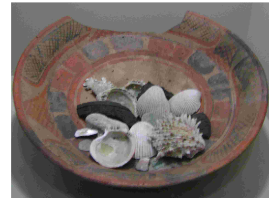
Fotografía 2. Plato policromo con ofrendas de diversa naturaleza, especialmente conchas marinas. Proviene del sitio Río Azul y está fechado para el Clásico Temprano. Museo Nacional de Etnología y Arqueología de Guatemala.

Un segundo canal, hoy reconocido como “San Jorge”, de aproximadamente 1750 metros de longitud, reveló un mejor manejo mediante un sistema de desniveles a manera de esclusas y puso de manifiesto una mayor necesidad del recurso hídrico, probablemente para incrementar la producción agrícola ante la creciente demanda de la población del lugar. Hacia finales del Preclásico Tardío (250 D.C.), ambos canales fueron rellenados, lo que sugiere una probable disminución del caudal del lago o su posible extinción para dicho período. Aún así, la construcción de un tercer canal –Mirador–, de menores dimensiones (230 metros), realizado a inicios del Clásico Temprano (250 D.C. 600 D.C.), sugiere que, aunque hubo una disminución del caudal del lago, este probablemente siguió suministrando agua a la ciudad durante buena parte de dicho período (fotografía 3).