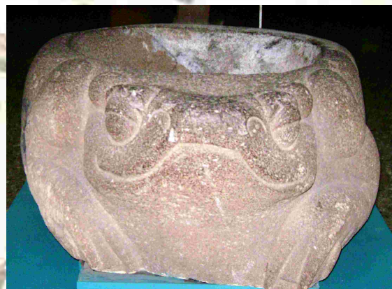
Fotografía 8. Escultura de sapo de grandes dimensiones (medio cuerpo humano adulto) proveniente de Kaminaljuyú y fechada para el Preclásico Tardío. Museo Nacional de Etnología y Arqueología de Guatemala.