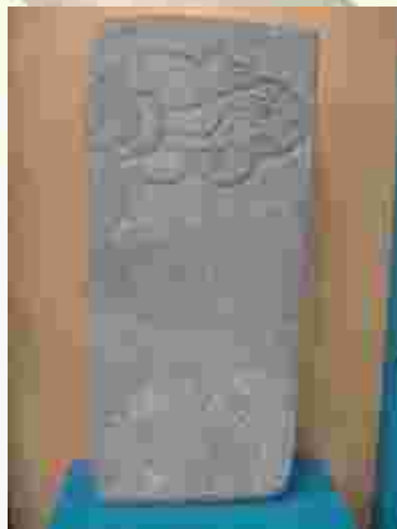
Fotografía 5. Monumento 1 de Kaminaljuyú que ilustra el glifo emblema de la ciudad.