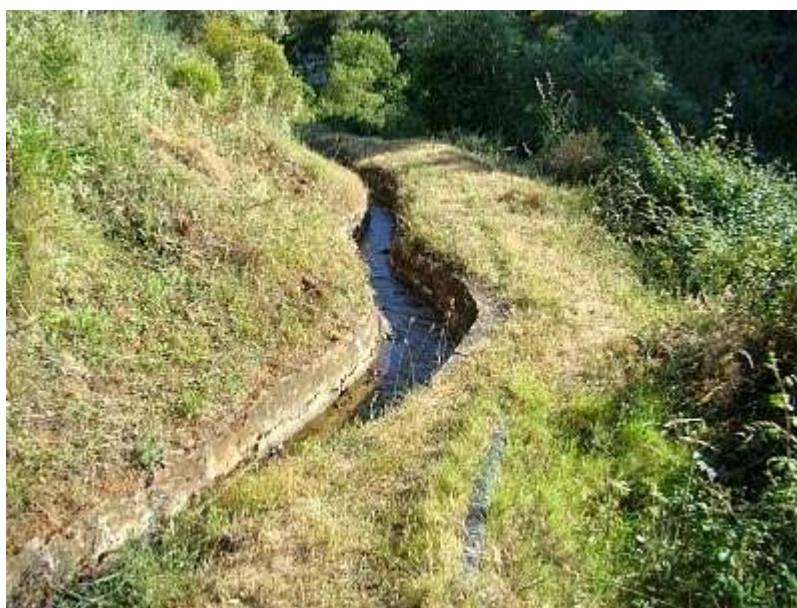
Fotografía 3. Forma de las acequias. San Ildefonso Ixtahuacán. Huehuetenango.